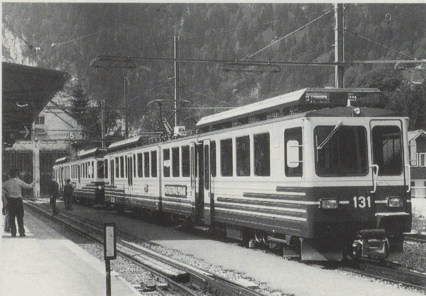
WAB. Triebwagens BDhe4/8. No.131 & 132 at Lauterbrunnen.

Lauterbrunnen - Wengen (Old route), Alpiglen - Grindelwald Grund. 25% Lauterbrunnen - Wengen (New route), Wengen via Kleine Scheidegg to Alpiglen. 19% All units fitted for multiple operation with or without driving trailer Bt. Line drawings and technical data supplied by S.L.M. Winterthur.