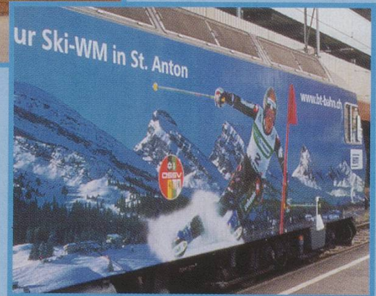
Two views of BT Re 4/4 456 094 in the special WTM St Anton livery as mentioned in Notepad.