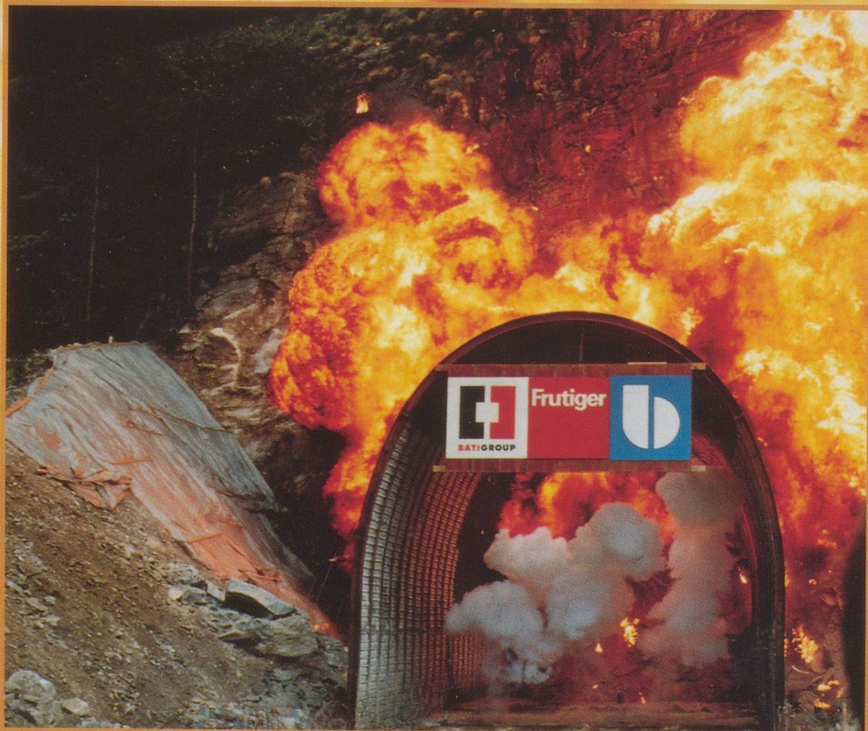
Definitely a photo needing colour for impact. George Hoekstra was bang on the mark with this one. "The Big Bang", The first blast on the Southern end of the new Gotthard Base Tunnel in Bodio on the 10th July 2000