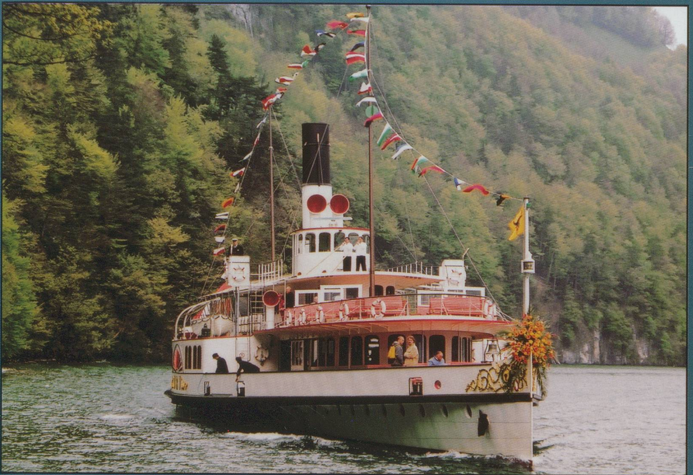
Above: DS Uri glides into Rütli to collect invited guests after the "Weg der Schweiz" celebrations and the day after her 100th birthday. The next Swiss Express will have more about this. 3/5/2001. Below: BLS MS Stadt Thun in her dragon guise glowers into Spiez. 26/5/01. See letter on p52 and make your choice.