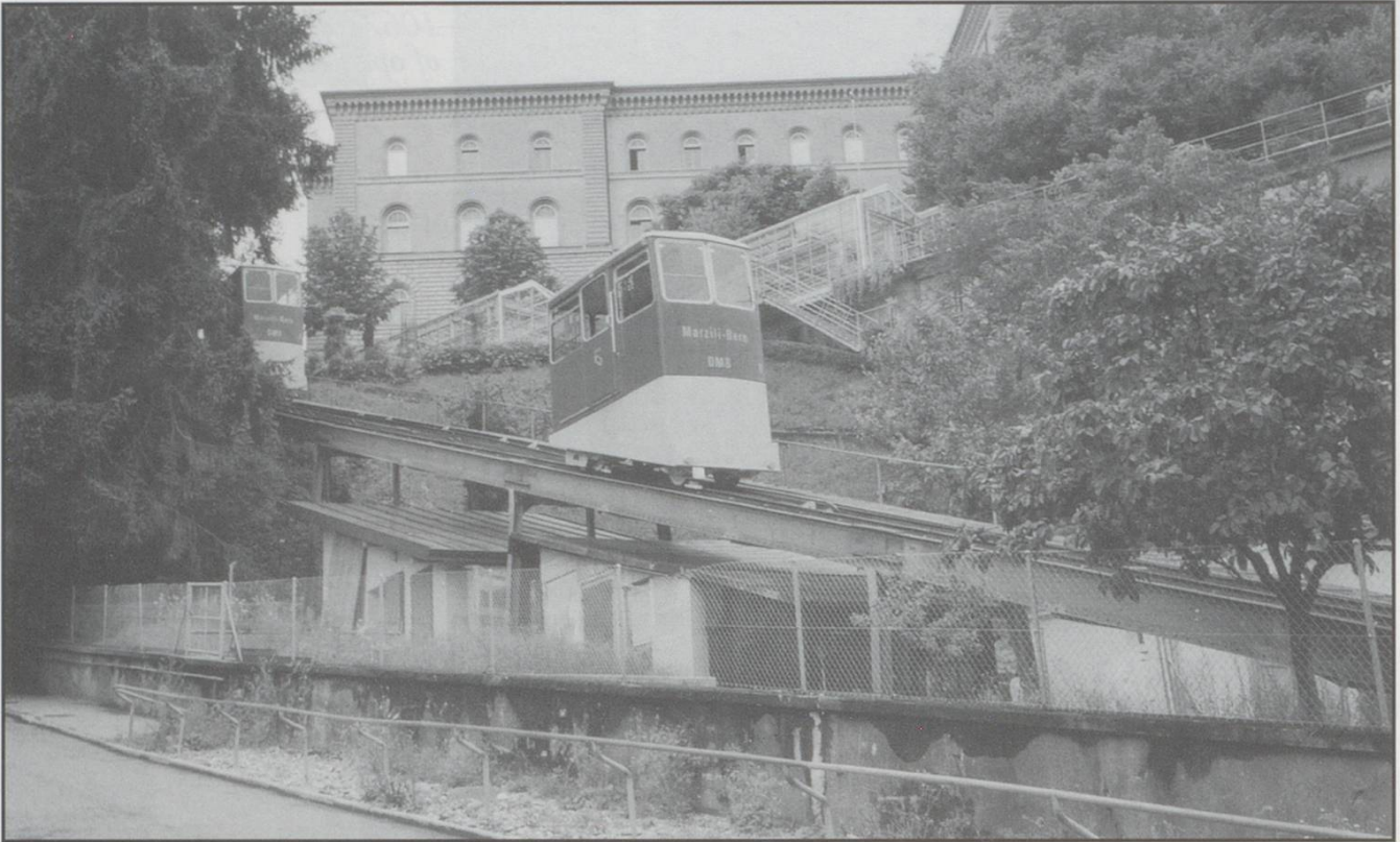
The two modern (1974) electric cars entering the passing loop.