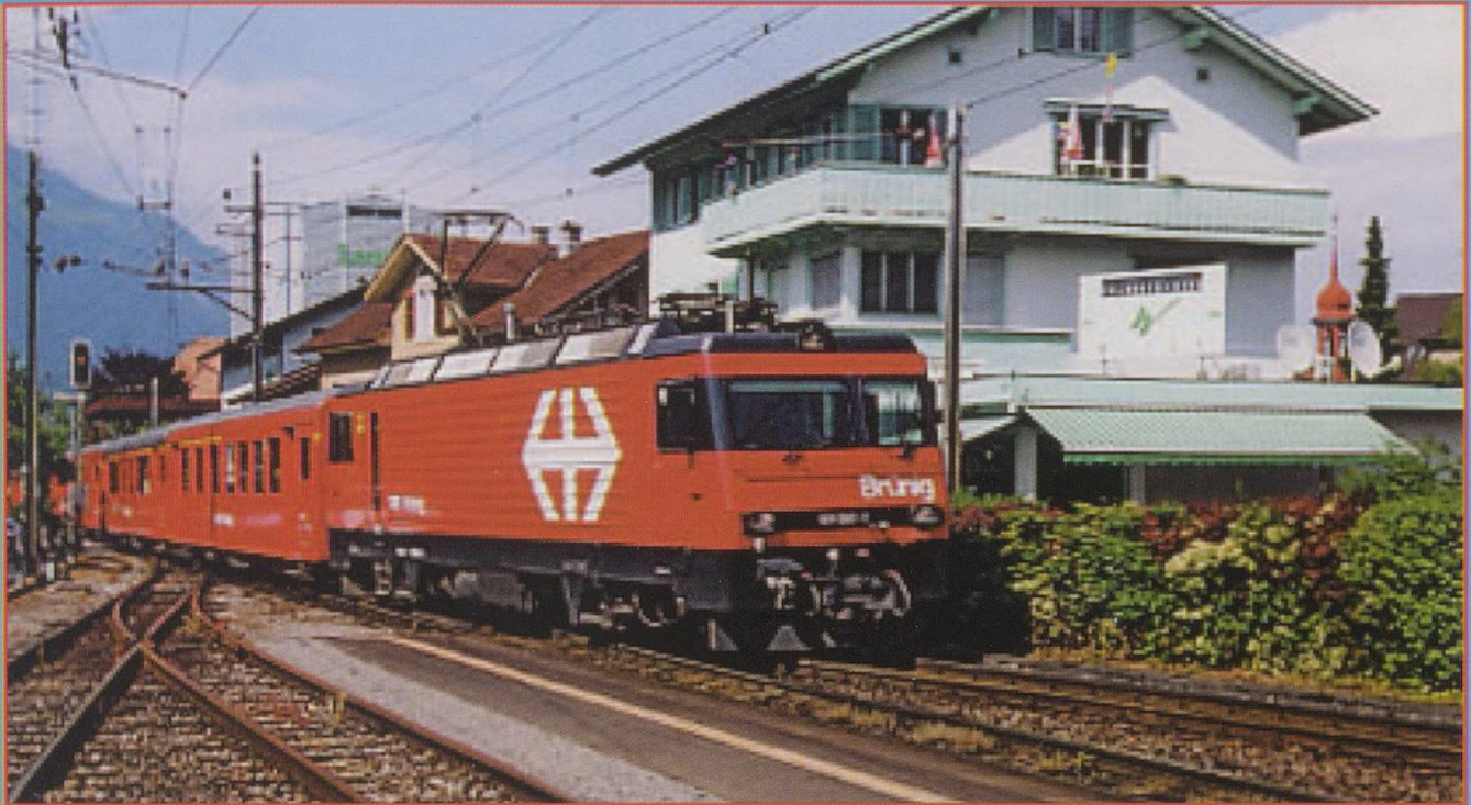
UPPER: SBB Brünig Line HGe 101 961-I arrives at Sarnen with an Interlaken train. May 2001. Photo DS LOWER: A Centovalli ABe4/6 no. 51 is seen from the driving cab of an earlier ABe8/8. May 2001. Photo DS

LEFT: The winner of the reader vote for PHOTOGRAPH OF THE YEAR 2001 was this composition from Paul Russenberger. SBB Re 460 017-7 in Märklin livery travelling along the Lötschberg near Lulden in August 2000