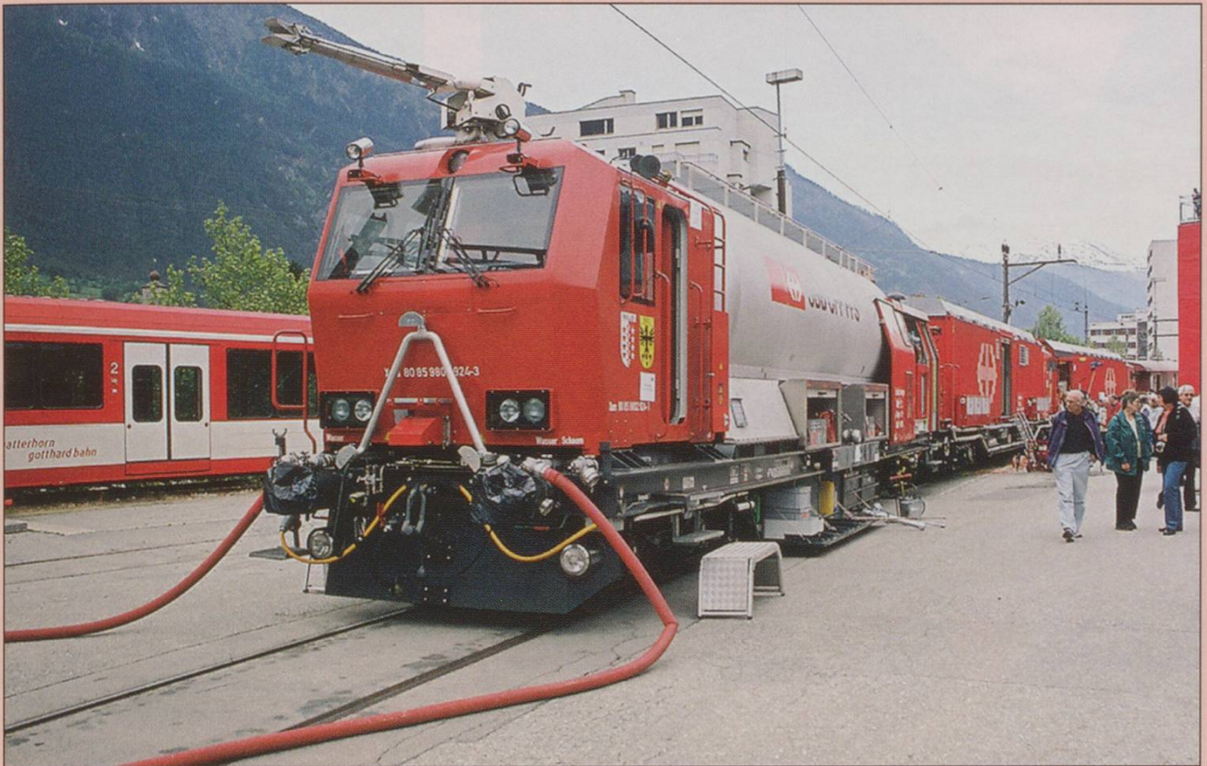
CFF fire train (Xams 80-85-9802924-3) on display at Brig during the Simplon Centenary celebrations.