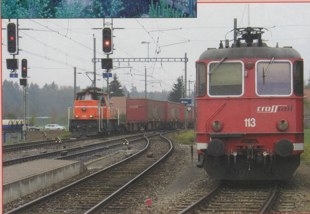
Crossrail freight locomotives at Wyler on 30th October 2006. John Porter