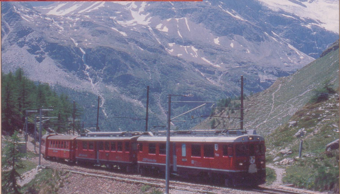
Climbing from Alp Grum toward the Bernina summit on 19 June 2005. S. Buck