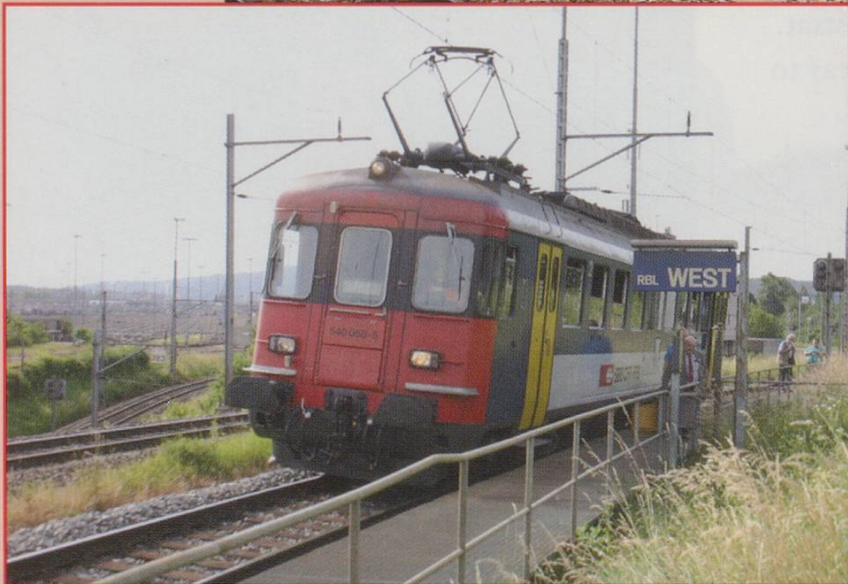
RBe 540 058 at Limmattal Yard West 19th June 2006.