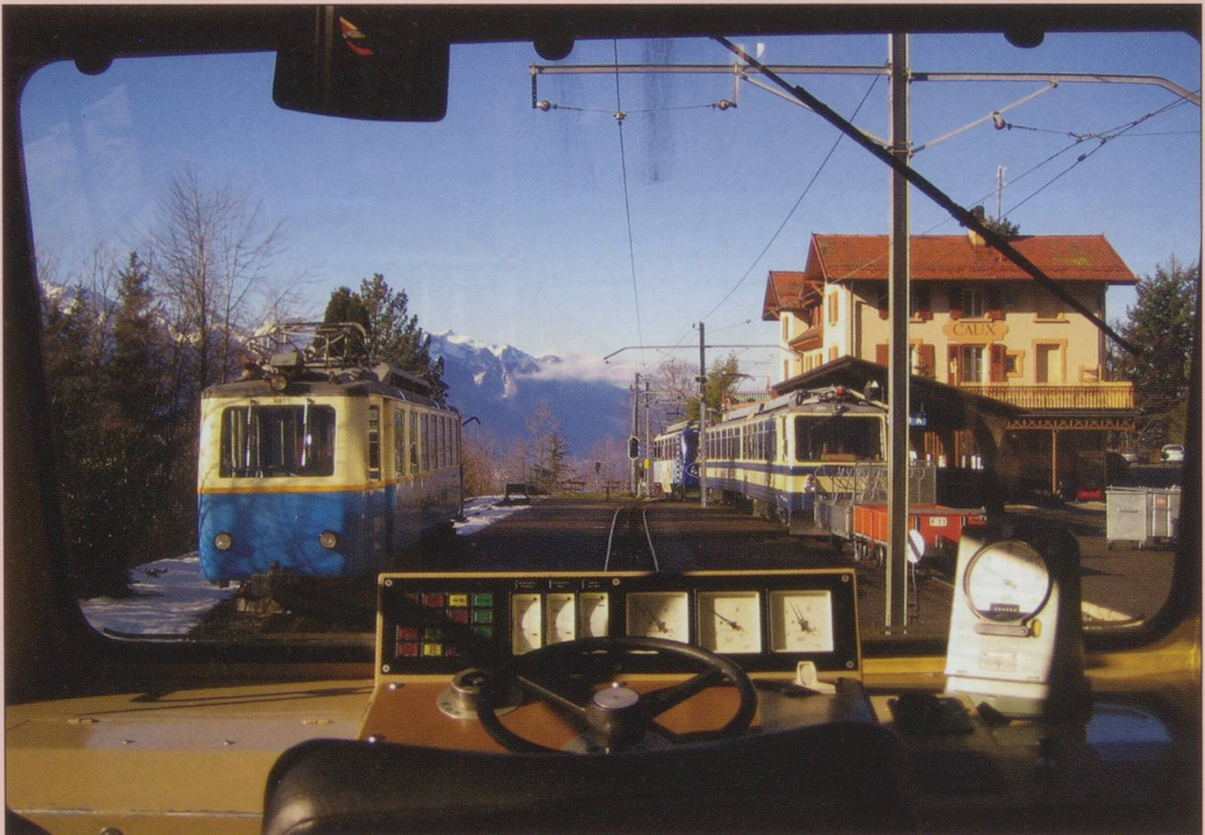
Caux station on 15th February, from the rear cab of Bhe4/8 303.