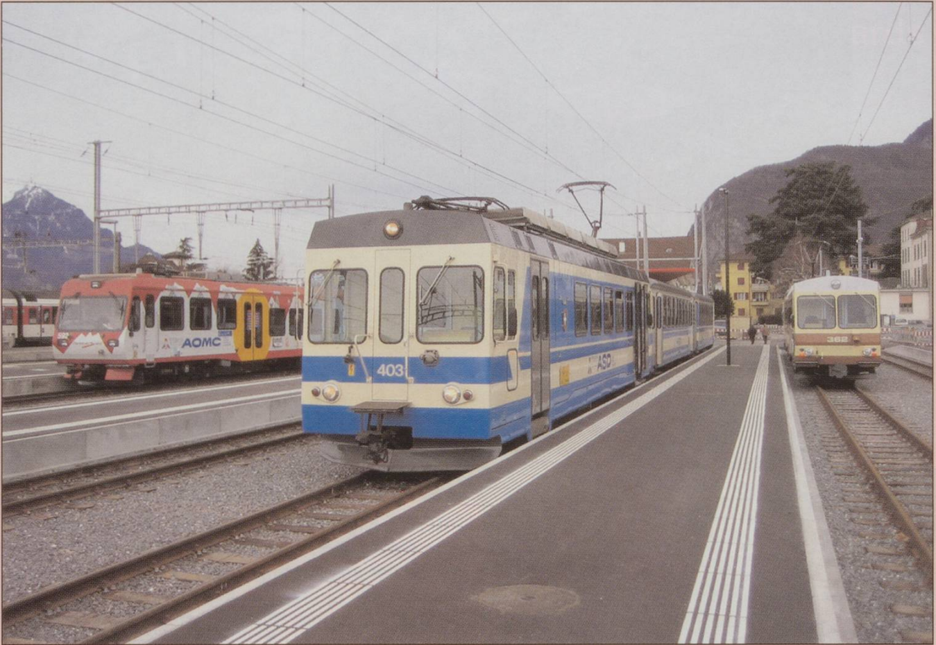
All change at Aigle with the new station forecourt layout.