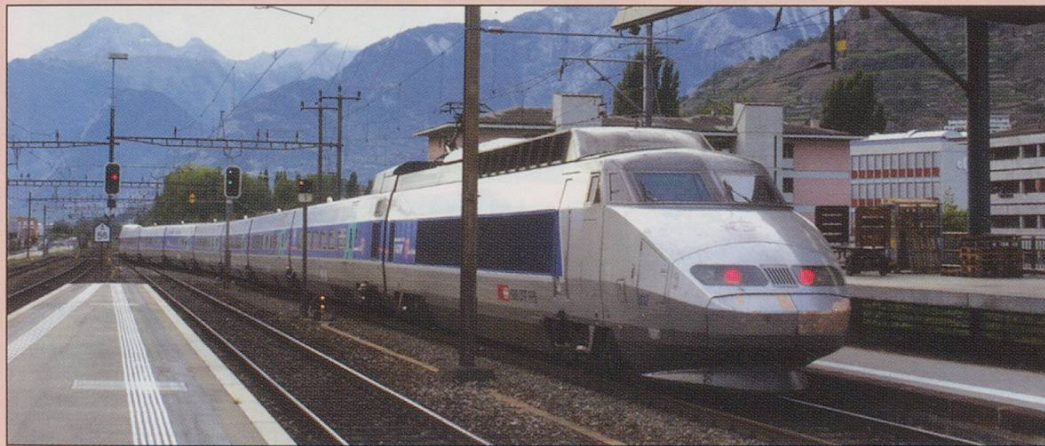
Summer Saturdays Only through Brig to Paris TGV leaving Sion in 16/09/06.