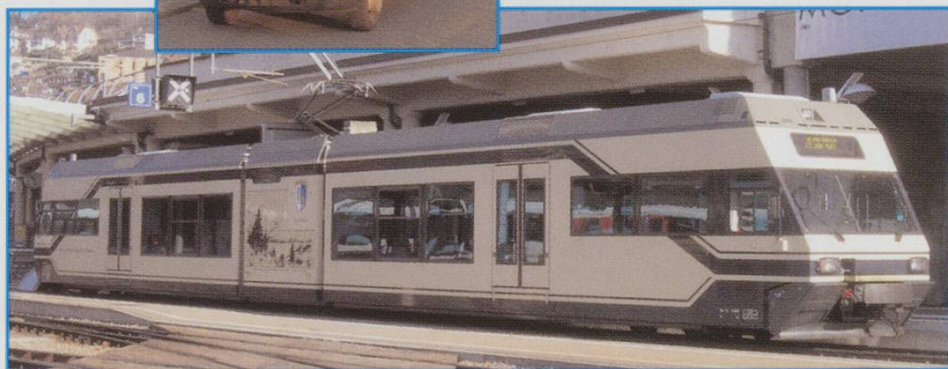
BELOW: MEV Stadler EMU waits at Montreux.