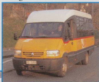
LEFT: Local Postbus waits for commuters at Chernetz.

EDITOR: The cover photograph of June 2007 issue of 'Swiss Express' is also related to this article.