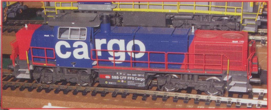
RIGHT: Mehano: SBBC Am 4/4 843.091