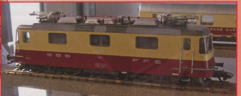
RIGHT: Mä/Trix: SBB Re 4/4I in TEE livery