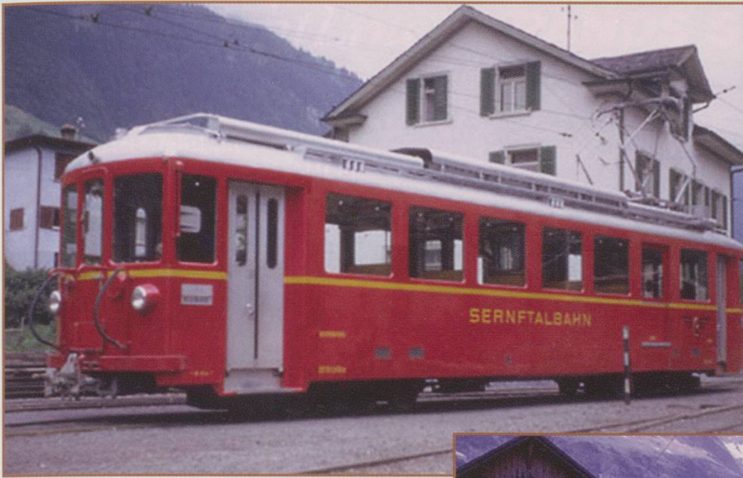
SeTB No. 6 is a CFe 4/4 built by SWS and MFO in 1949 and still at work with the Stern & Hafferl organisation on the Achensee line in Austria. The picture is also taken around 1969 at Elm station by Peter Sutter. The red livery comes from the colour of the regional arms Glarus/Glaris/Glarona with the Saint Fridolin in black on the red ground.

Following the note in Sidetracks (Dec. Swiss Express ) there is a lot to report on this interesting project. Work has been progressing well, with a hardy band of volunteers working on restoring the old goods shed at Engi. Over 300 man hours have cleaned the accumulated dust and rubbish, and more than 30 kilos of paint has been applied! The museum is well on target to be opened to the public on 18th April 2009. An increasing amount of artefacts, pictures and documents are being accumulated for display. Two of the latest are a diesel engine (still full of oil) from a first generation diesel bus and