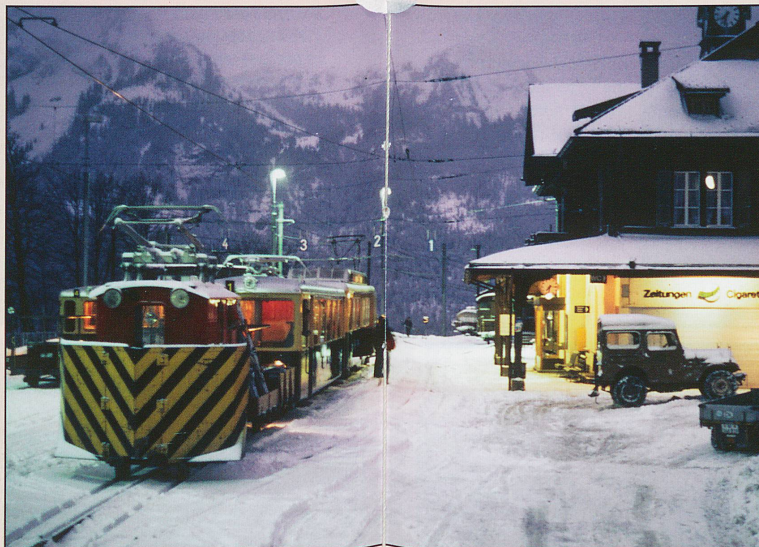
Xrote stands in Wengen station before the skiers arrive in February 1983.