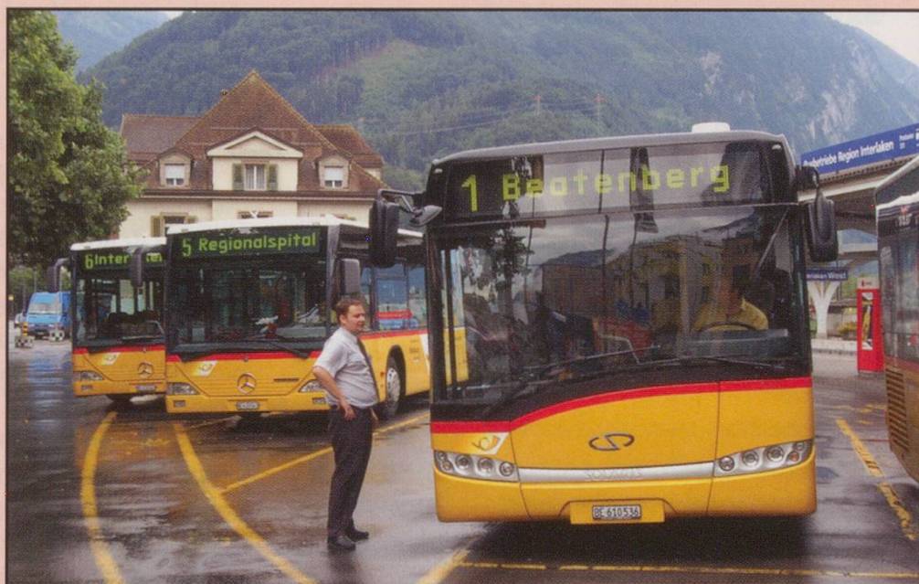
A new Solaris Post Auto awaits passengers at Interlaken West for the next run up to Beatenberg on 29th July 2008, though in this weather the views won't be too good.