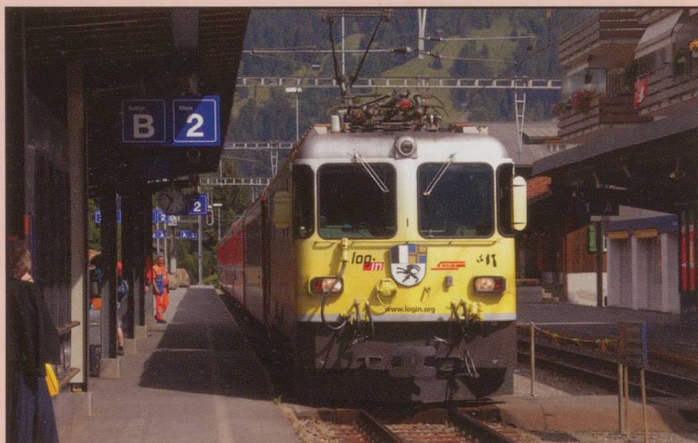
Ge4/4 II No.611 Landquart arrives at Klosters with a morning train for Scuol Tarasp, 24th July 2008.