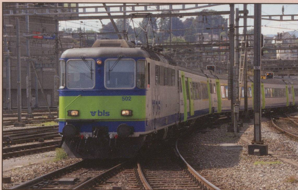
BLS Re4/4 II N0.502 arriving at Luzern with the 09.37 Regio Express from Bern, 23rd July 2008.