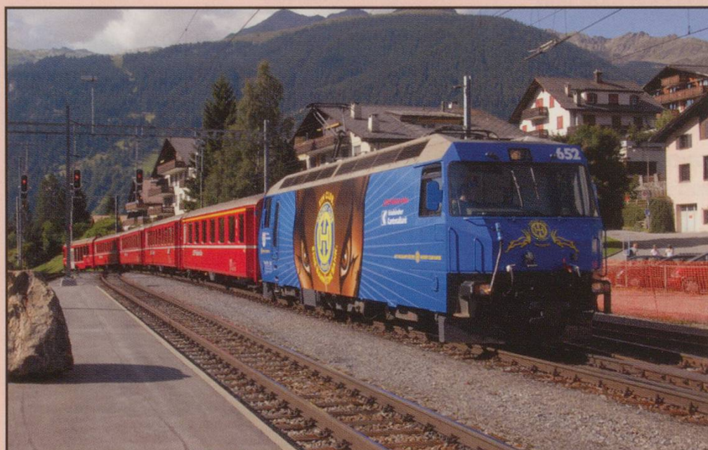
Ge4/4 III No.652 Lenzerheide-Valbella arrives at Klosters with a Davos train, 24th July 2008.