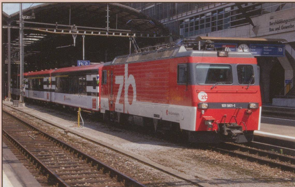
Zentralfbahn HGe4/4 101 No.961-1 heads out of Luzern with the 11.55 Interreggio for Interlaken Ost, 21st July 2008.