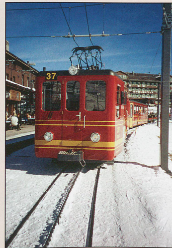
In the new livery, Jungfrauabahn BDeh2/4 No.207 stands at Kleine Scheidegg in February 2006.