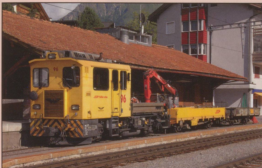
A worktrain headed by RhB Tm2/2 No.96 rests at Klosters, 24th August 2008.