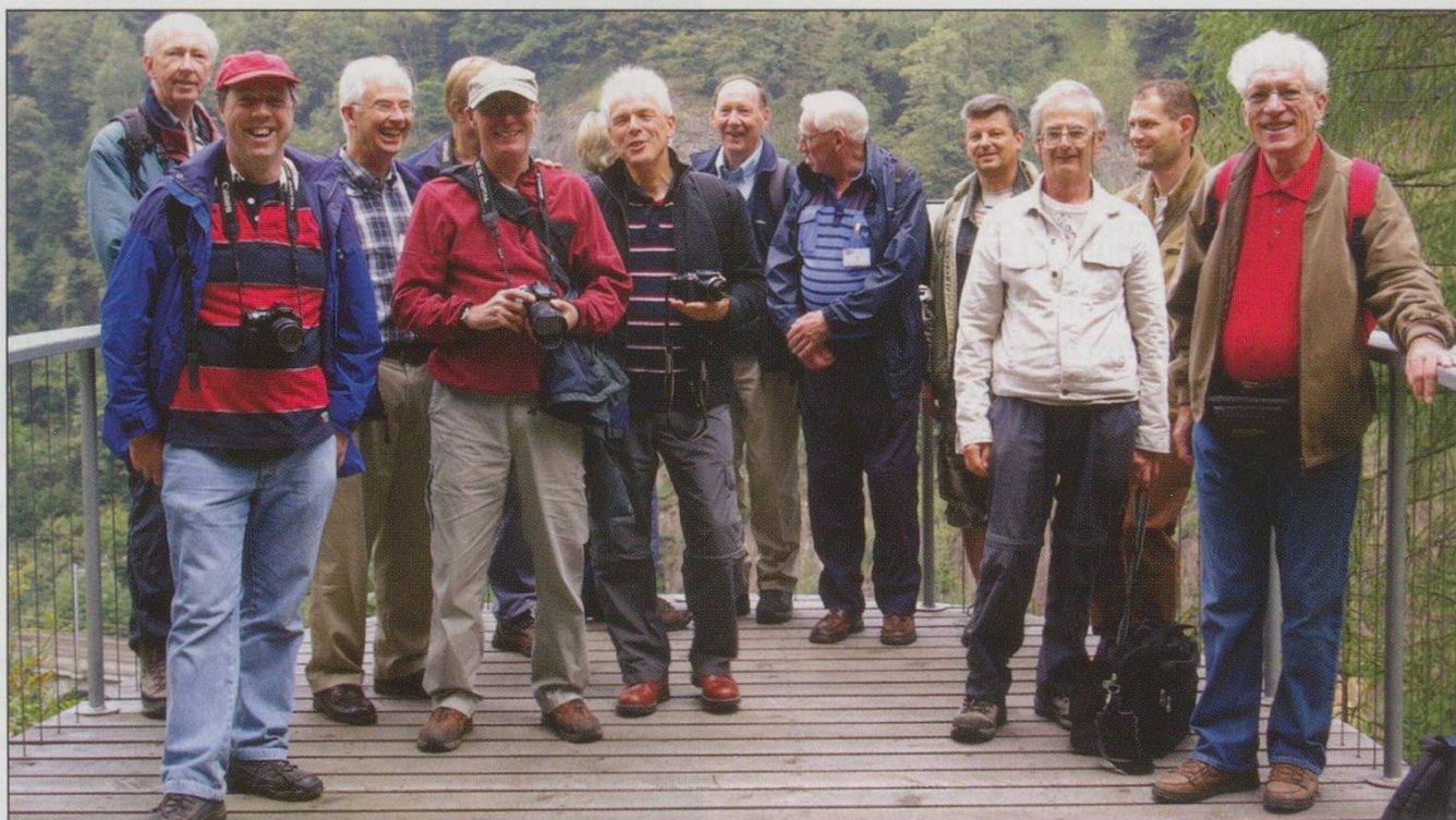
The walking group on the Saturday, posed on the viewing platform above the Secken viaduct.