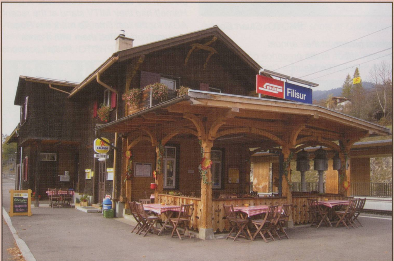
Filisur Station after its alterations. The new buffet extension sits alongside the bells, retained following protests at their proposed demise, 24/10/2007.