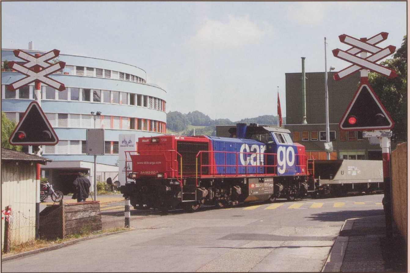
The sign on 843053 as it straddles an ungated crossing in a well known busy Swiss city says CAR(CAN'T)GO, but they certainly can't whilst the train is parked there.