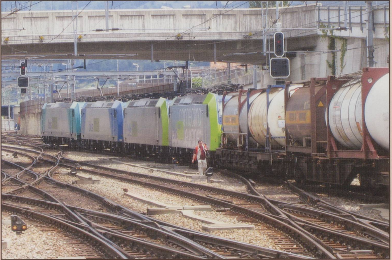
"Plenty of power at Spiez". 13/6/2007.