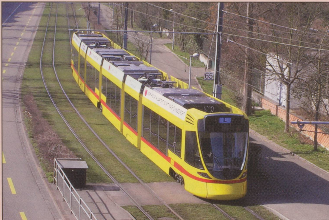
No. 151 out on crew training on March 18, heading out on the BLT Line 10 leaving station Zoo, Basel. This is the first of 4 prototype 'Tango' trams from Bombardier.