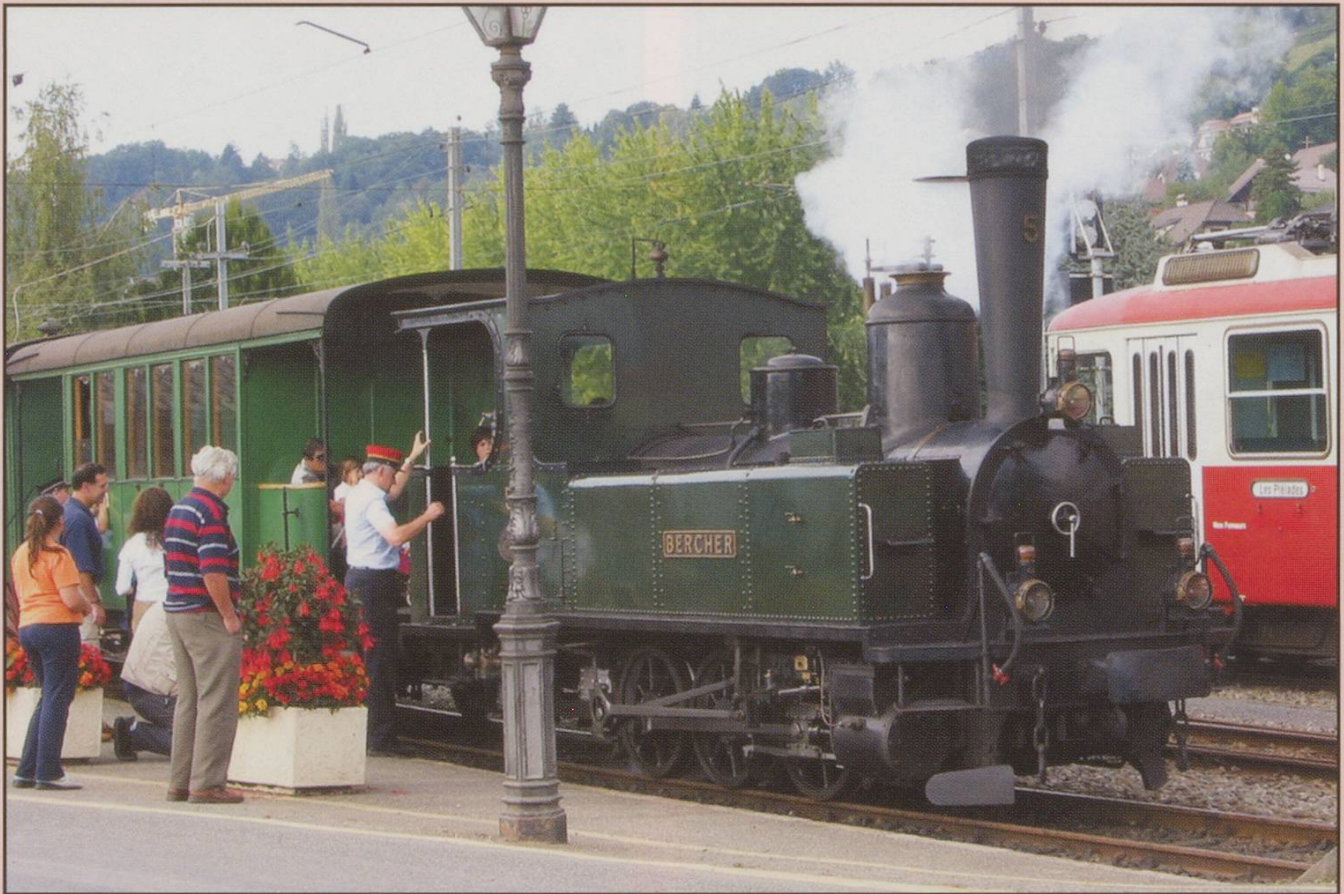
Steam Engine "Bercher": at Blonay, 7/9/2002.