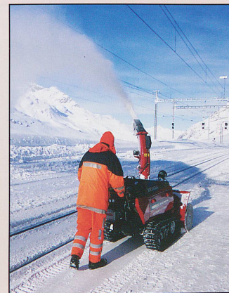
A sunny Sunday morning in January 2009; one of the station staff at Ospisio Bernina clears the platform of some of the overnight snow.