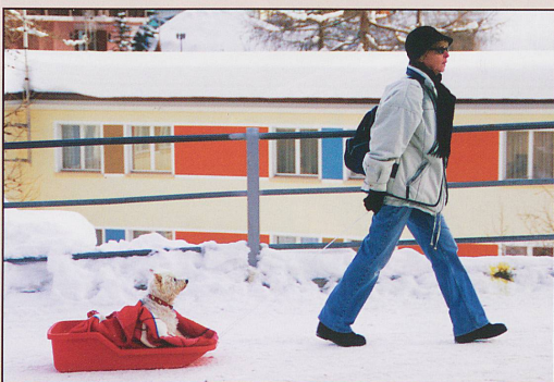
"I'm just taking the dog out for a drag". This lucky Westie was spotted in Arosa at the end of January.