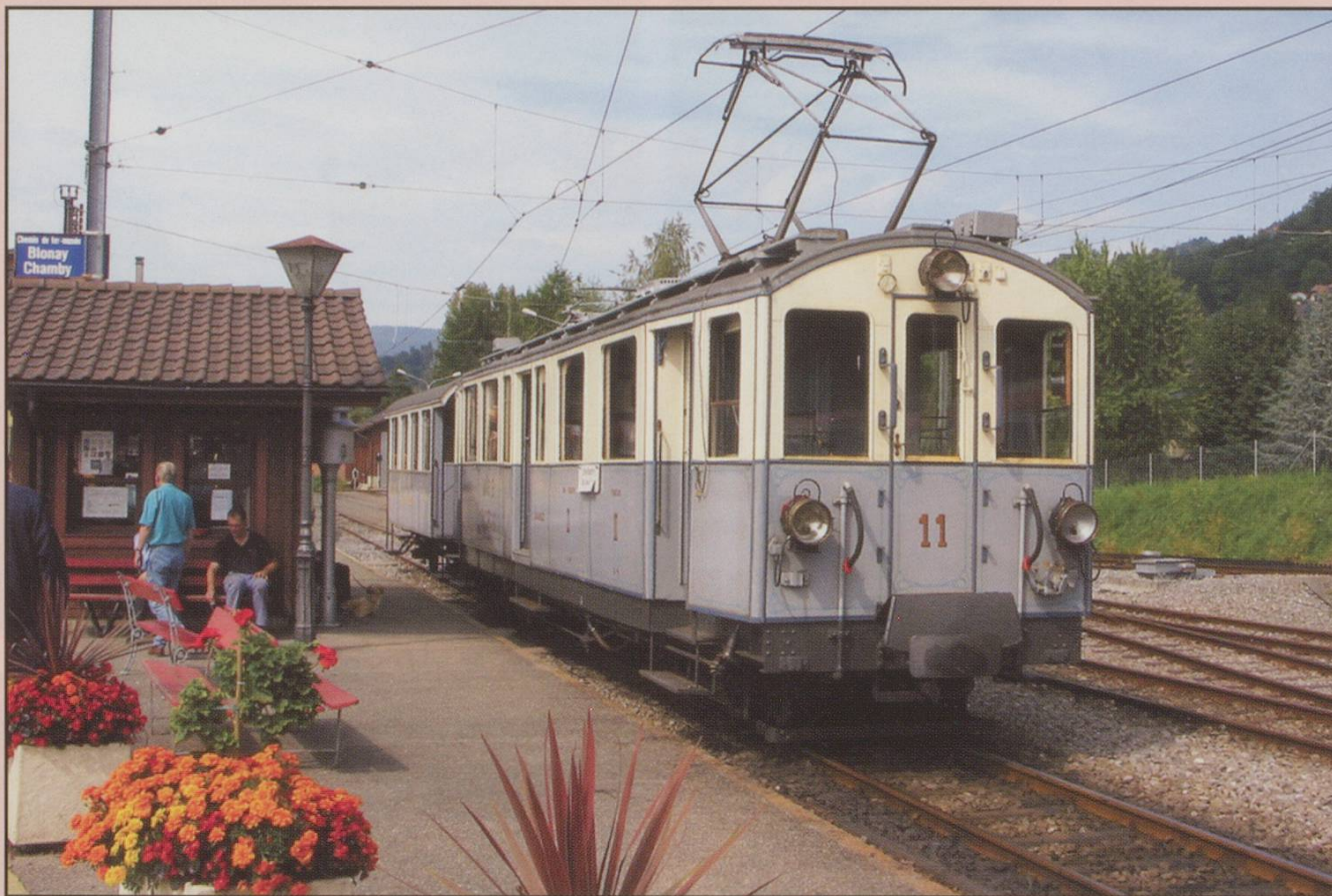
MOB ABDe4/4 No 11 at Blonay, 7/9/2002.