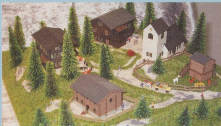
Kibri Z. Alpine buildings, three houses, stable and church, issued separately (not as a set). The N scale buildings are identical.