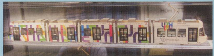
Navemo. Zürich Cobra tram in special livery for 175 years of the university.