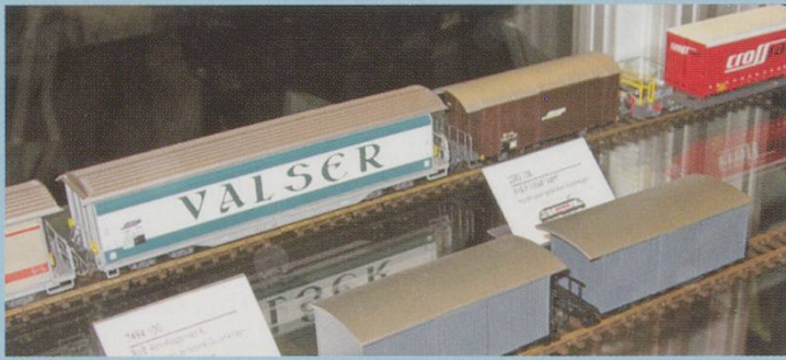
Bemo. A selection of the new freight vehicles. At the back, the re-issued "Valser" van, the "A&M" private van, container wagon with "Crossrail" container. In front, body moulds for the early RhB vans.