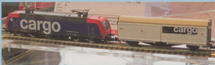
Fleischmann N. SBB Cargo Re 481 with one of the 3-set of Hbills-303 vans.