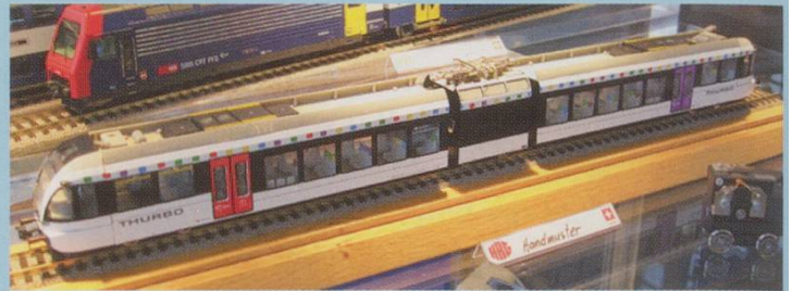
HAG. GTW 2/6 Thurbo.