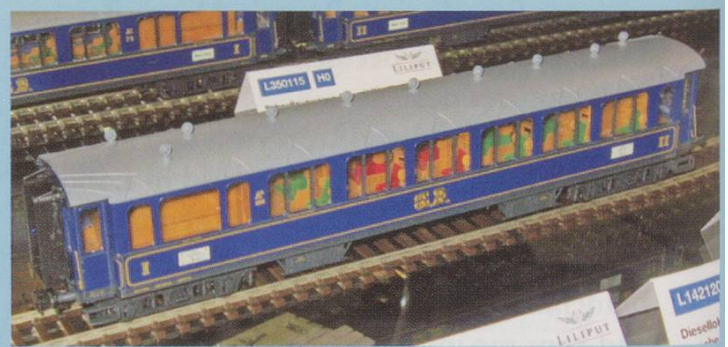
Liliput. Additional coach for the Gotthardbahn set.