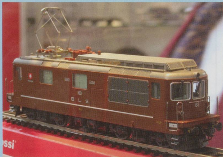
Rivarossi. BLS Re 4/4 183 with metal body.