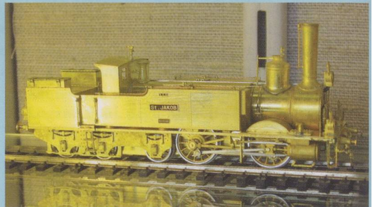
Fulgurex HO. Unpainted Ec 2/5, named "St Jakob".