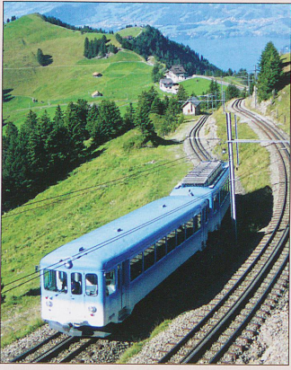
A train on the Arth-Rigi-Bahn is climbing from Staffel to Rigi Kulm at the beginning of September 2010.