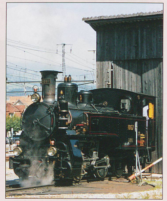
BDB HG3/3 No 1067 at Giswil.