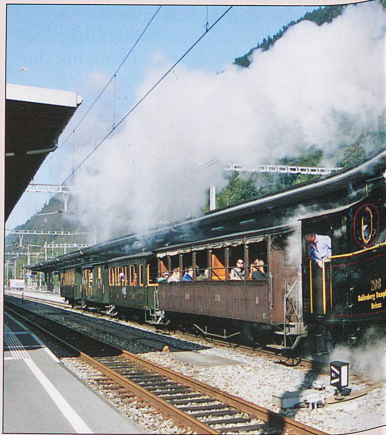
Ballenberg Dampfbahn G3/4 No 208 leaving Interlaken Ost.