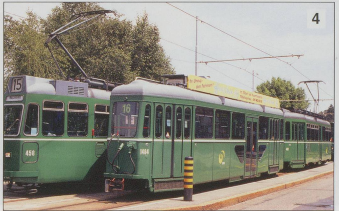
1. BLT Swiss Standard 'Piggy Bank' trailer Barfusserplatz on peak hour route 17. 2. BVB 461 interior.