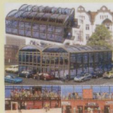
BUS1026 Sports Hall Was £25.99 Now £17.99