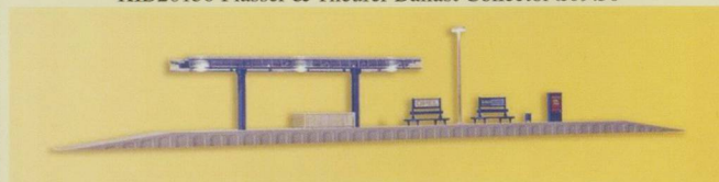
KIB49556 Modern Platform 51cm – plus Platform lights and furniture £24.95

Trade Enquiries Welcome www.ontracks.co.uk or give us a call. E&OE UK P&P : OnTracks.co.uk, Pontilas Business Park, Hereford, HR2 0AZ info@ontracks.co.uk