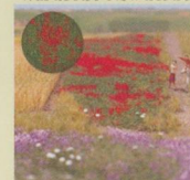
BUS7185 Poppy Field Was £7.99 Now £5.40 BUS7186 Thistle Field Was £7.99 Now £5.40