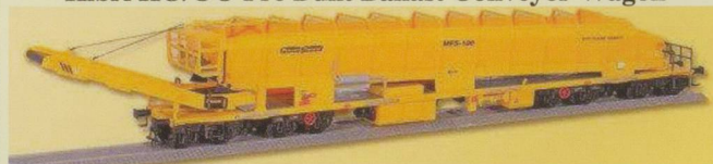
KIB26150 Plasser & Thurer Ballast Collector £69.50