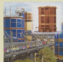
BUS1006 Hi Rise Office Block HO/OO Was £30.99 Now £19.99