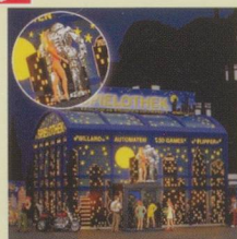
BUS1003 Amusement Arcade HO/OO Was £29.99 Now £17.99