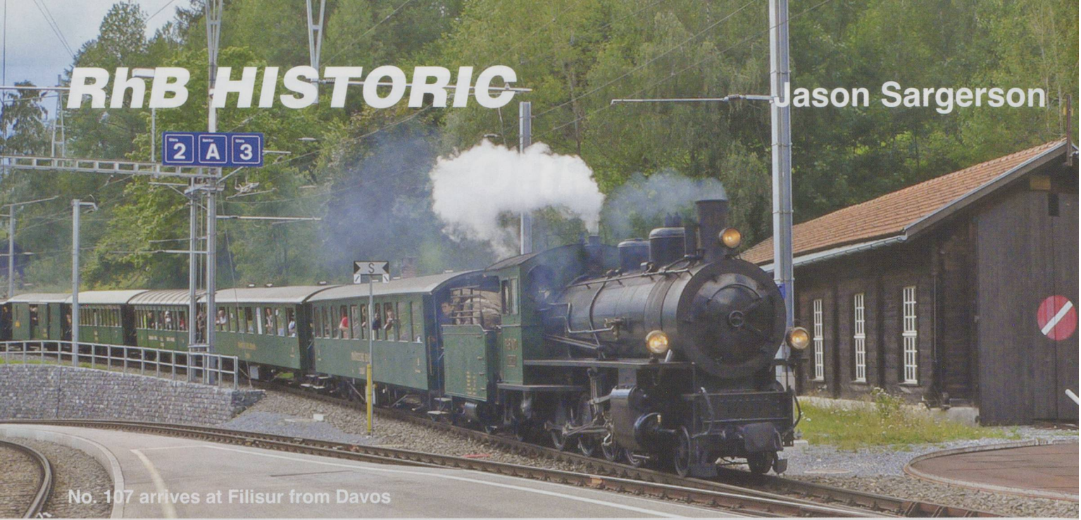
No. 107 arrives at Filisur from Davos