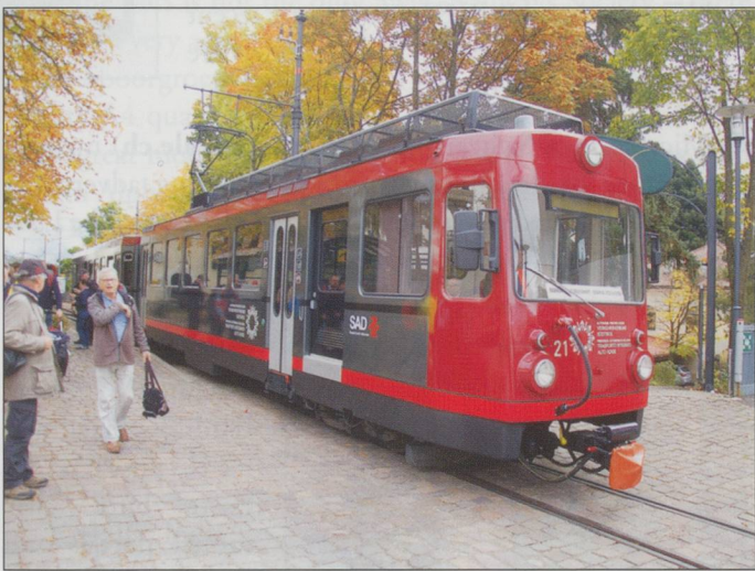
BELOW RIGHT: No21 approaching Wolfsgraben Ritten.