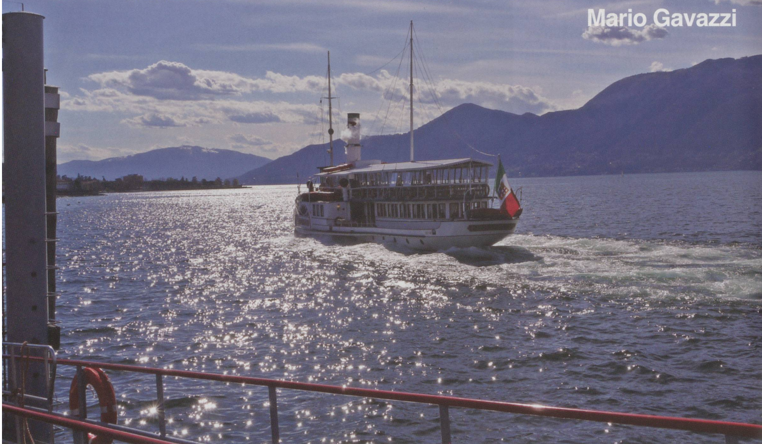
"Piemonte" starts its return trip to the shipyard at Arona.