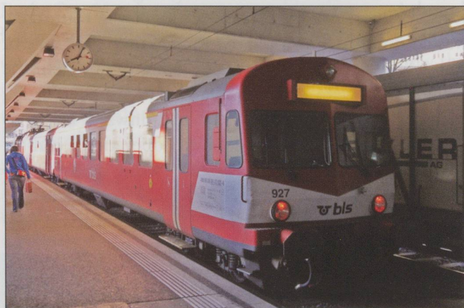
This shows the train prior to leaving Luzern SBB.

Well done! - The crew of 'ps Piemonte' ready for a picture at the end of the cruise in Luino.