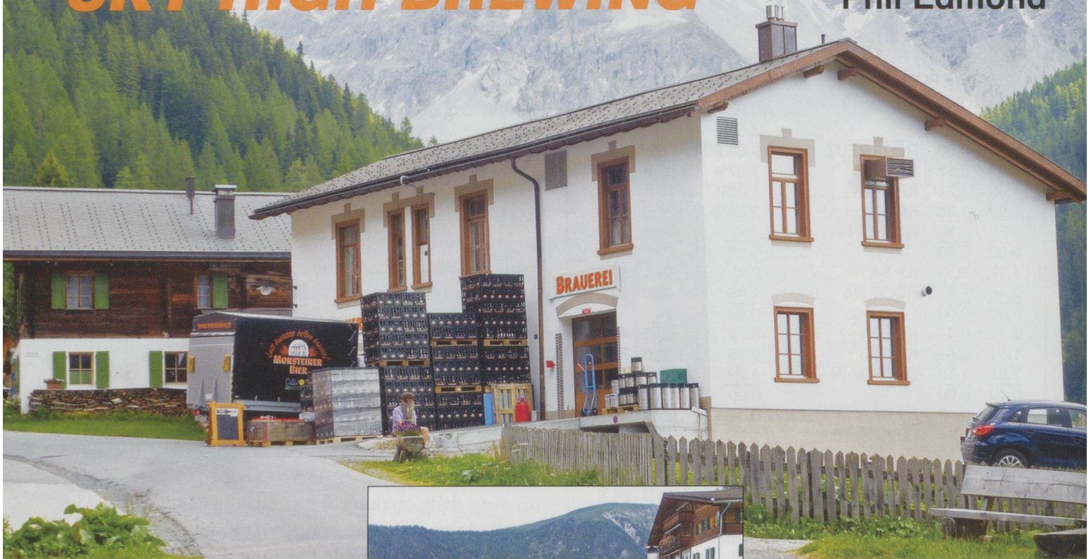
The small brewery at Davos Monstein.

The Monsteiner Brewery, at 1625m, is the highest brewery in Europe and is situated in its namesake village of Monstein (GR). As railways, of all types, and beer always seem to go well together it is significant that this outpost can be easily reached by using the Rhätische Bahn from Davos or Filisur alighting at Davos Glaris, NOT Davos Monstien. Confusing - yes! An hourly PostAuto service will then take you some 200m up to the village where you have just a 5min walk to the brewery, sited in what was once the village dairy. Pre-booked guided tours are available (some include transport on a vintage PostAuto), but on