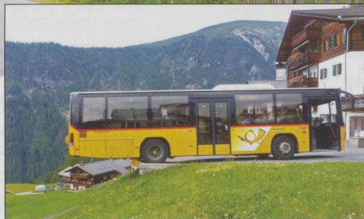
INSET: When the Postbus parks, its rear considerably overhangs the car park !!

The Monsteiner Brewery, at 1625m, is the highest brewery in Europe and is situated in its namesake village of Monstein (GR). As railways, of all types, and beer always seem to go well together it is significant that this outpost can be easily reached by using the Rhätische Bahn from Davos or Filisur alighting at Davos Glaris, NOT Davos Monstien. Confusing - yes! An hourly PostAuto service will then take you some 200m up to the village where you have just a 5min walk to the brewery, sited in what was once the village dairy. Pre-booked guided tours are available (some include transport on a vintage PostAuto), but on