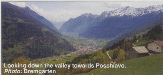
Looking down the valley towards Poschiavo.

Through many a curve, tunnel, snow-shed and cutting the train rattles onwards, then turns once again. We see in the valley the town Poschiavo, away down below us, set out on the plain.