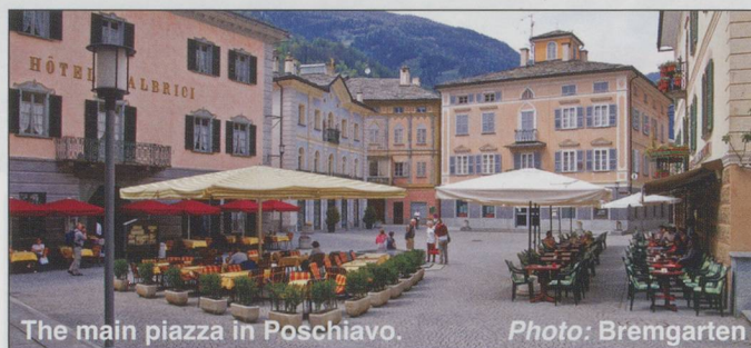
The main piazza in Poschiavo.

By roadside the train carries on to Le Prese, a neat little village, and with it the lake, 'twixt the road and the lakeside' meandering onwards, 'till we reach Miralago, and put on the brake!