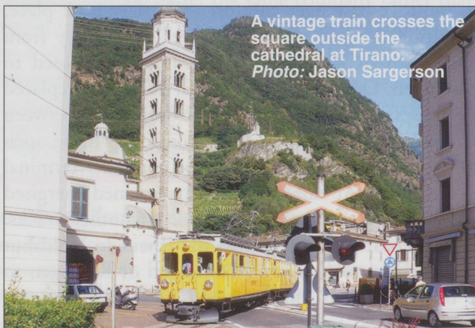
A vintage train crosses the square outside the cathedral at Tirano.