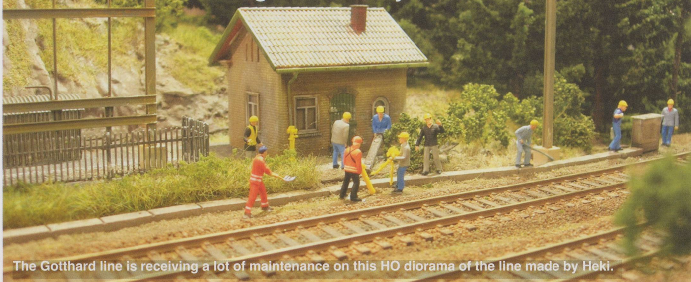
The Gotthard line is receiving a lot of maintenance on this HO diorama of the line made by Heki.

The number and variety of accessories that are now available for model railways in all of the popular scales is enormous. There are detailing parts in plastic, in resin, in white metal and other materials. Some come ready assembled and painted, others arrive in unpainted form or as a kit. New products are being introduced constantly.