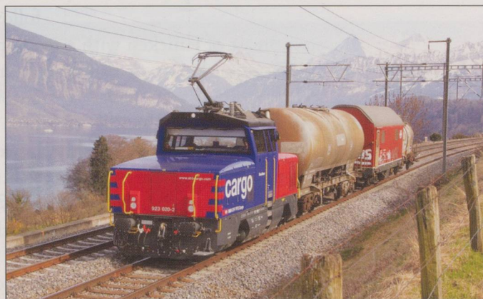
Cargo loco 923-020-2 hauls a short train towards Thun.