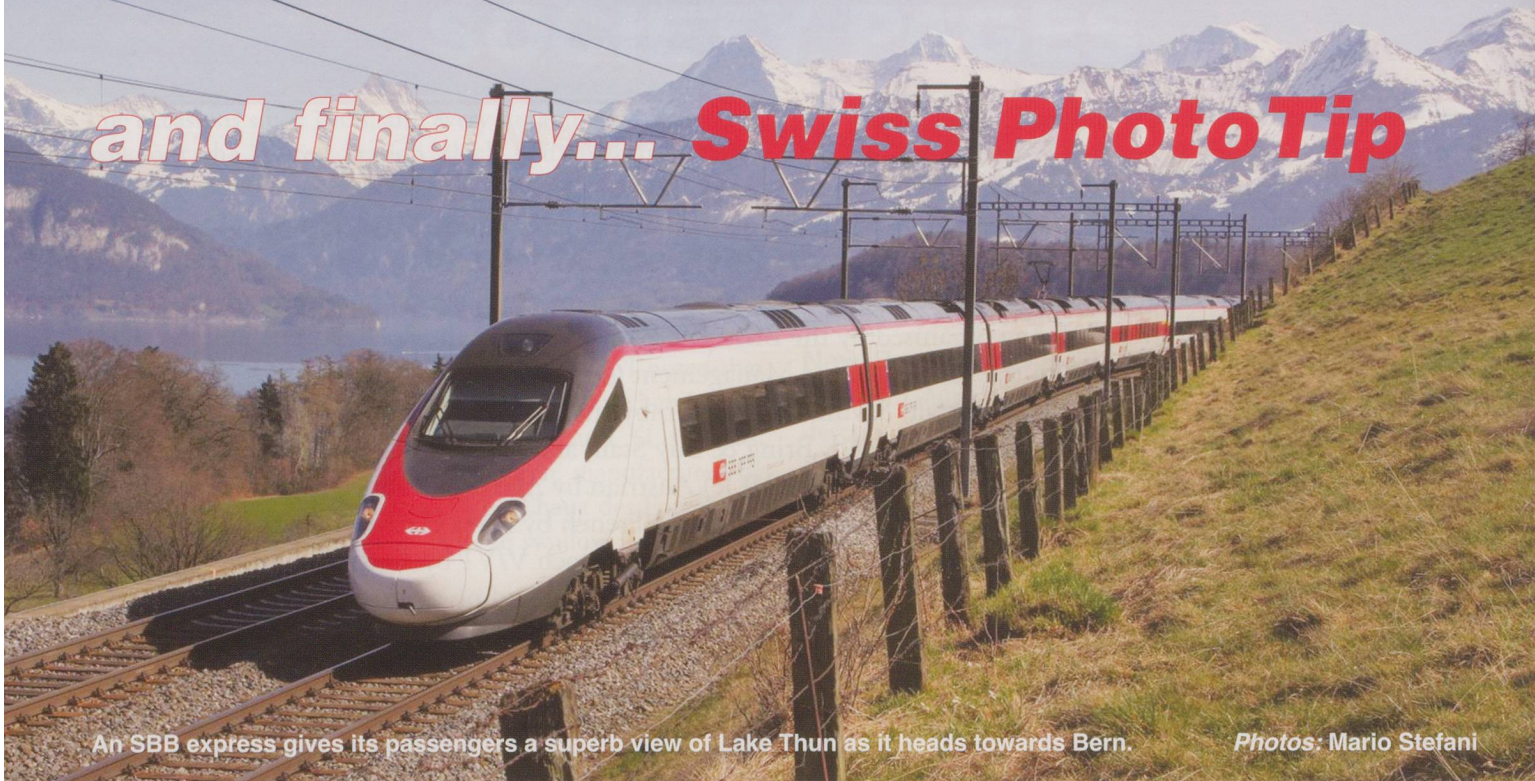
An SBB express gives its passengers a superb view of Lake Thun as it heads towards Bern.