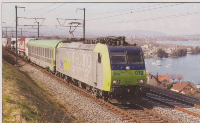
BLS Re 485-012-9 hauls a train of lorries south from Thun.