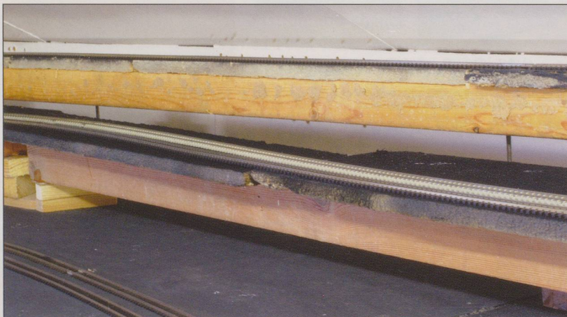
The landscape foundations before the addition of the plaster cloth and cork bark.

loft that measures approx. 18ft x 10ft with the baseboards being about 2ft wide arranged around the 4 sides of the loft. Half of the layout has scenery with the remainder being used for storage sidings. There are 2 main levels with double track lines on both plus a branch line leading up to a 3rd level. The track was weathered with various shades of track dirt or sleeper grime mainly using Railmatch aerosols. Landscape foundations are a mixture of timber, hard foam, plaster cloth and cork bark. The scenic materials are mainly Woodland Scenics Fine Turf and Polyfiber; static grass fibres by Noch and W W Scenics and Greenscene light grey tarmac textured paint. Adhesives are mainly PVA and extra hold hairspray. The buildings are a mixture of Faller, Vollmer and Pola with figures by Noch. The road vehicles, including a number of obligatory PostAutos are by Rietze, Wiking and