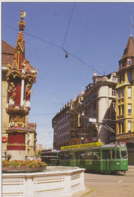
TOP: BVB Swiss Standards 457 + 1473 on Line 15 at Aeshenplatz on 23 May 2014. LEFT: BVB Swiss Standards 465 and trailer and the Fischmarkt fountain on 23 May 2014.