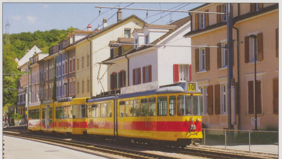
BELOW: BLT 1970s SWP articulated car 103 on the rear of double-articulated 216 near Münchenstein Dorf on Line 10 on 23 May 2014.