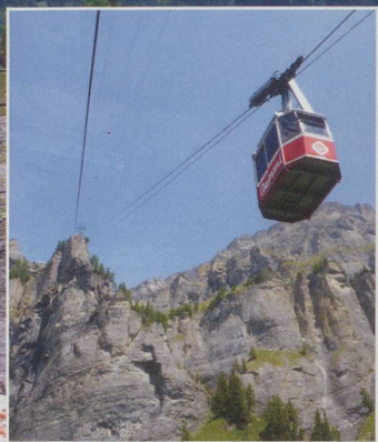
MAIN PICTURE: Looking back down on Leukerbad. LEFT: The cablecar up from Leukerbad.