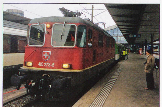
RIGHT: Re6/6 Gotthard Christmas Special. See ‘Re6/6 Hauled Rail Tours...’, Page 33.