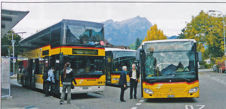
LEFT: Last of the double decker buses at Stans Bnf. See ‘Changes to ‘British’ Transport’, Page 32.