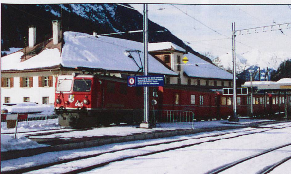
LEFT: 605 Bergün Schlittelzug. See ‘RhB Problems’, Page 29.