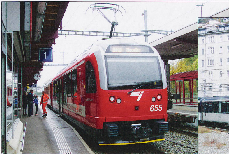
CJ Be4/4 655 at Saignelegier.