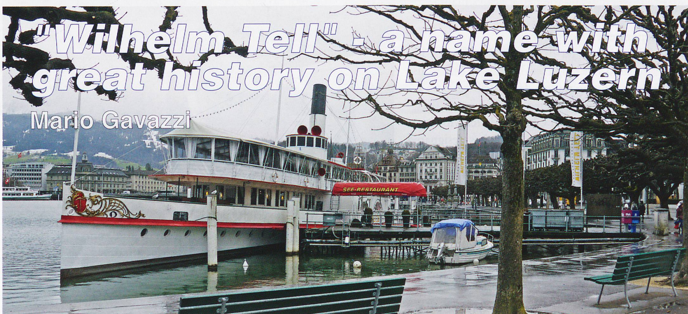
The restaurant "Wilhelm Tell" moored at the same place as the first 'Tell', January 2018.