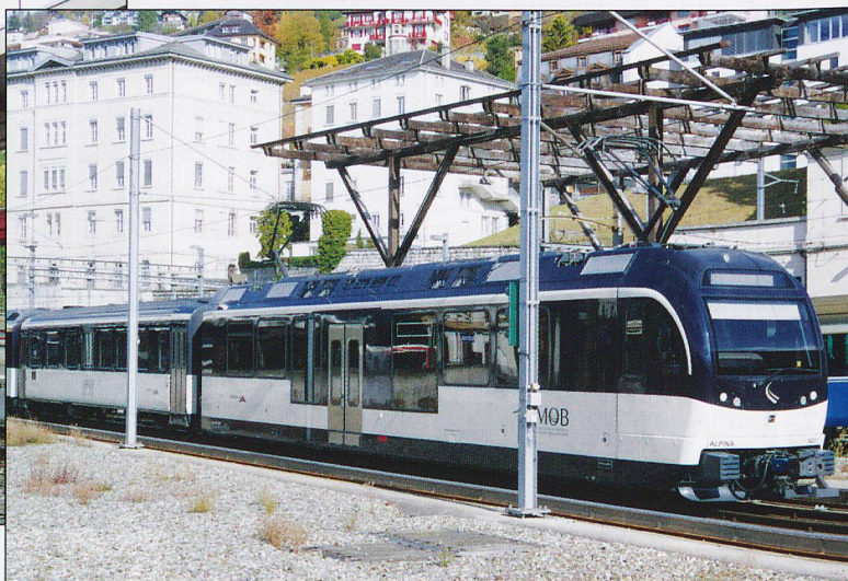
MOB Be4/4 9201 at Montreux.