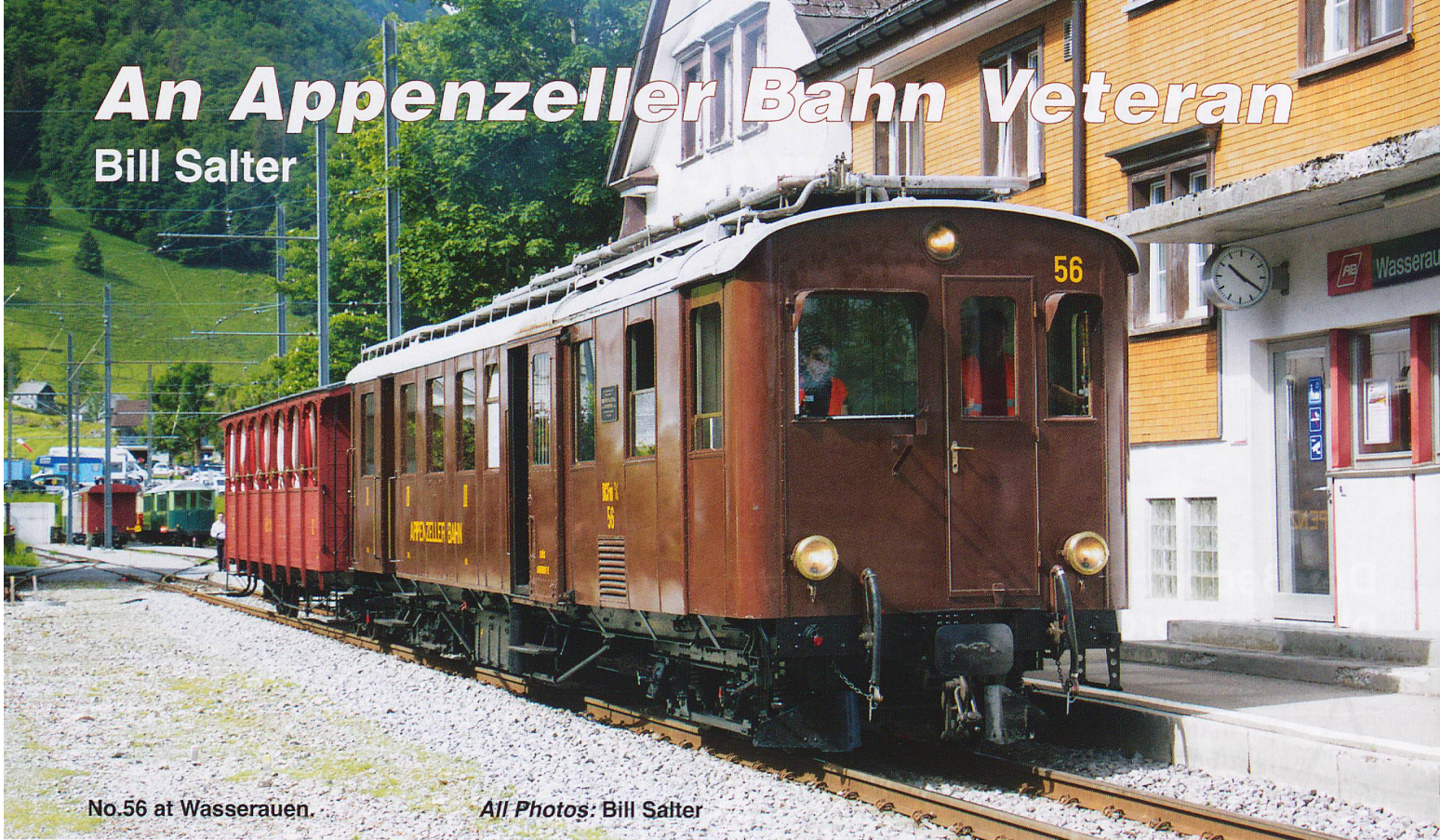
No.56 at Wasserauen.