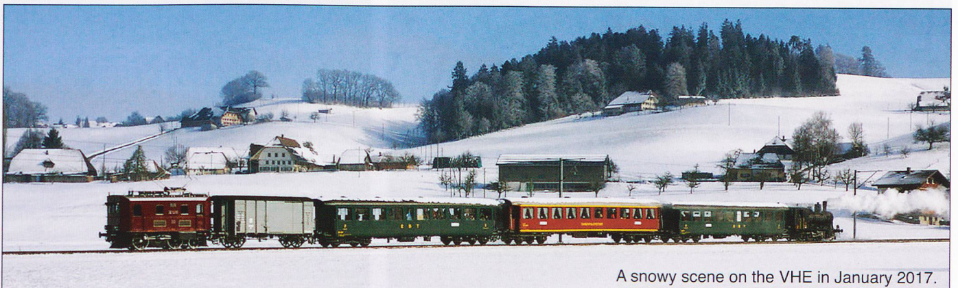
A snowy scene on the VHE in January 2017.