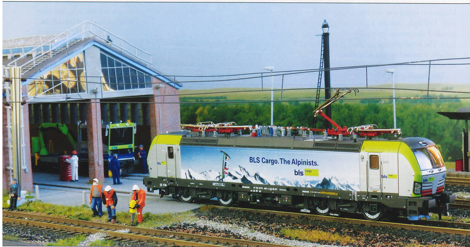
The completed diorama. Roco BLS Vectron and Kibri Tm 235 on shed.