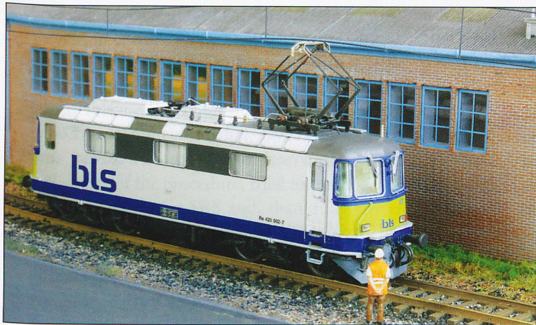
ABOVE: Roco BLS Class 420 stands alongside the shed.