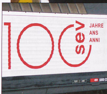
RIGHT: The SEV is 100 years old.