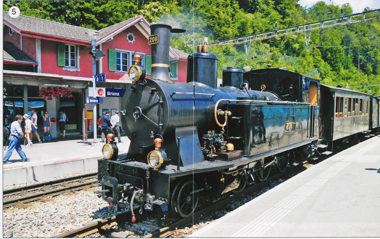
1. Alarmed at the imminent arrival of MOB dual-gauge vehicles in Interlaken, the Zentralbahn holds secret tests in Summer 2016 at Meiringen works with HGe 101 968 with an eye to converting their network to "Gartenbahn" gauge and thwarting MOB's expansion plans. Photo: Shoto Thomas 2. A Solaris Postbus at the side of Lake Brienz on the outskirts of Bonigen, en route from Iseltwald to Interlaken West. Photo: Peter Keating 3. A lovely teak Wagon Lit coach in the special train spotted by Peter Keating. Photo: Mark Fox 4. SBB Historic BDe 4/4 No 1643 at Bauma. Photo: Mark Fox 5. G3/4 No 208 at Brienz station with its historic coaching stock of the Ballenberg Dammbahn on the 30th June, 2018. Photo: Paul Sampson