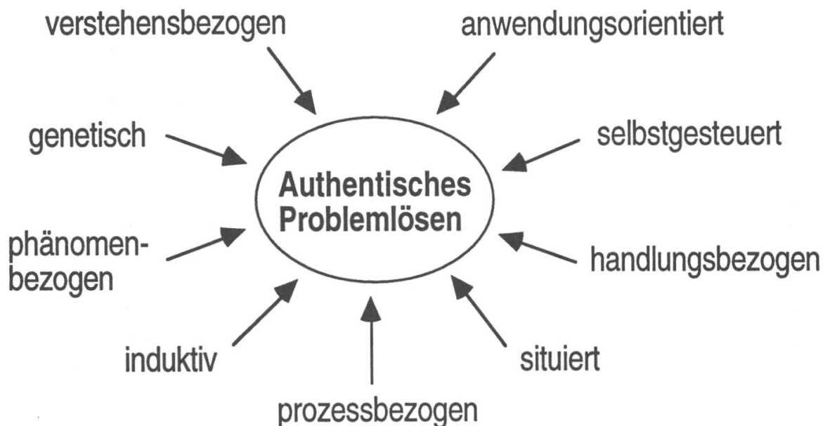
Abbildung 1: Experimentieraufgaben sollen authentisches Problemlösen messen und fördern. Die Abbildung zeigt einige, in der Fachliteratur aufgeführte Facetten dieses schillernden Begriffs.

Durch den Einbezug anspruchsvoller Anwendungsaufgaben in die Schulleistungstests will man in den USA zum einen Verstehens- und Problemlöseleistungen kontextualisiert und umfassender messen (Baxter & Shavelson, 1994), zum anderen die Unterrichtsgestaltung und die Lern- und Denkprozesse der Schülerinnen und Schüler stärker in Richtung 'higher order thinking' lenken (Resnick & Resnick, 1992; Shepard, 1992). Im Hinblick auf diese Ziele werden u.a. authentische, lebensweltliche, bedeutsame, interessante, herausfordernde und anspruchsvolle Experimentieraufgaben empfohlen (Shavelson & Baxter, 1992). Man hat dabei komplexe, in fachlichen Kontexten verankerte Handlungsprobleme vor Augen, die relevante Bildungsinhalte verkörpern, mehrere Lösungen zulassen und Lern- und Problemlöseaktivitäten auslösen, die sich mit den in Abbildung 1 dargestellten Attributen charakterisieren lassen.