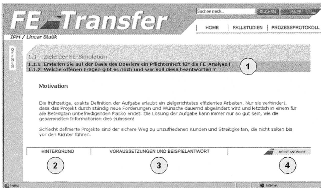
Abbildung 3: Bildschirmoberfläche für die Leitung durch Fragen der Fallstudie

Die nachfolgende Abbildung zeigt die Gestaltung der Bildschirmoberfläche für die Studierenden. Sie werden im web-basierten Teil des Lehrgangs mit Fragestellungen, Zielorientierung und Motivation (1), Hintergrundinformationen (2) und Hinweisen betreffend Voraussetzungen (3) durch die Fallstudie geleitet.