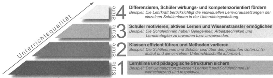
Abbildung 1: Hamburger 4-Stufenmodell zur Unterrichtsqualität (Pietsch, 2013, S. 26).

Für die Umsetzung der Studie war das Angebot-Nutzungs-Modell der Unterrichtsqualität und -wirksamkeit ein hilfreiches Konstrukt. Über dieses Modell können Lehr-Lern-Prozesse in der Qualität und in der Quantität beschrieben und Wirkungen von Unterricht nach fachlichen, überfachlichen und erzieherischen Aspekten sowie Sozialisierungseffekten ausdifferenziert werden (Reusser & Pauli, 2010). Als Referenzrahmen für das Erforschen von Unterrichtsqualität insgesamt hat sich die Arbeit mit dem unten abgebildeten Hamburger 4-Stufenmodell (Pietsch, 2013) als zielführend erwiesen.