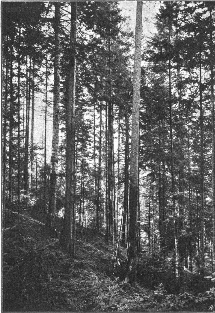
Deux épicéas, très „propres“ se trouvant dans une partie claire du Dürsrütti.

A deux kilomètres au N.-O. de Langnau, sur la hauteur qui domine le confluent de l'Emme et de l'Ilfis, se trouvent les belles fermes du Dürsrütti.