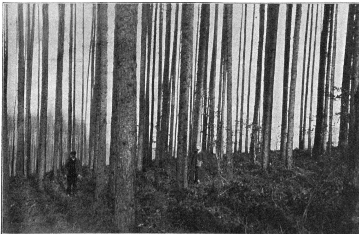
Répartition des tiges; vue prise en diagonale des lignes. Le sol est recouvert d'une épaisse couche de ronces.

moins onéreuse que la création d'un peuplement sur un sol découvert abandonné par la culture agricole. Dans le premier cas, la reprise des plants est plus facile, car ceux-ci bénéficient de l'humus accumulé et de l'ombre des rejets durant les premières années; par contre, il faut surveiller la plantation durant un certain temps et la défendre contre le taillis jusqu'au moment où la cime des plants est franchement dégagée. Sur une prairie nue la reprise est plus difficile et le déchet causé par la sécheresse est parfois con-