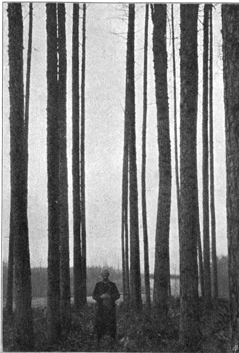
Ecartement des lignes: 2,50 m; distance des arbres dans la ligne: 2,50 m.

Plus d'un propriétaire se dirait que puisque une essence a donné un rendement aussi élevé, durant le dernier demi-siècle, il serait absurde de replanter autre chose que du mélèze.