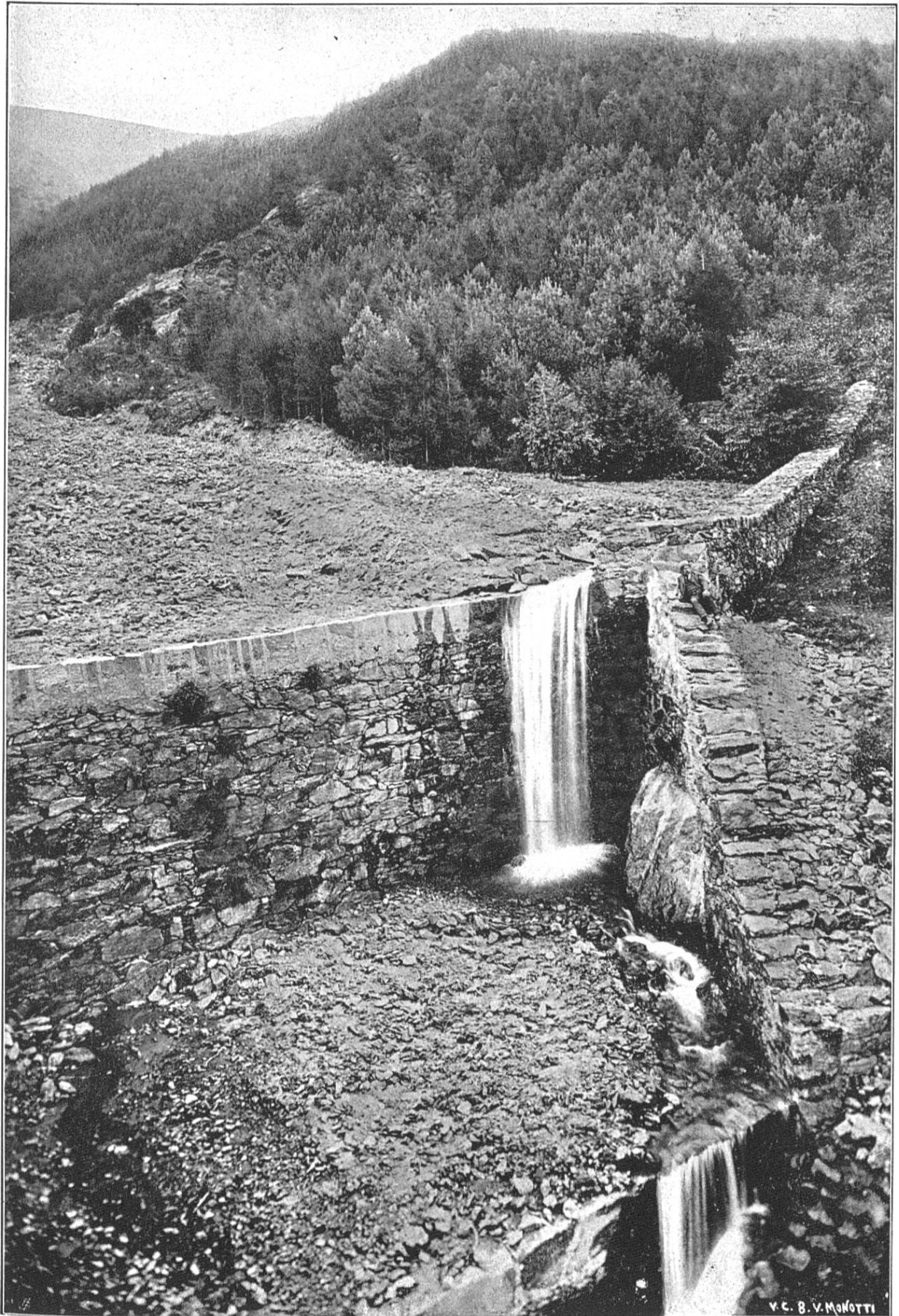
Bassin supérieur du Cassarate, Val Colla. Barrages et reboisements (mélèzes et pins) Pietrarossa, Colla.