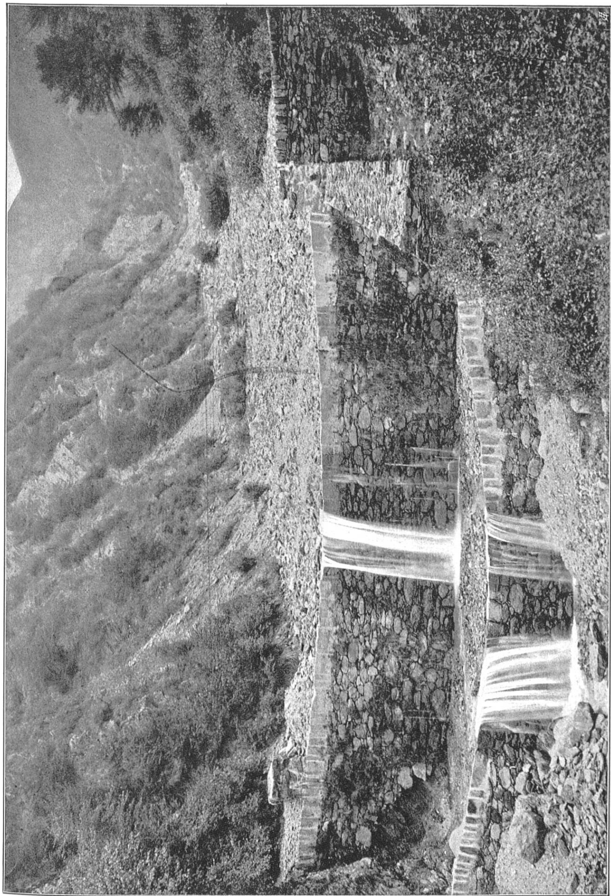
Bassin supérieur du Cassarate, Val Colla. Reboisements et barrages, Val Colla-Signora, sotta Pietrarossa.