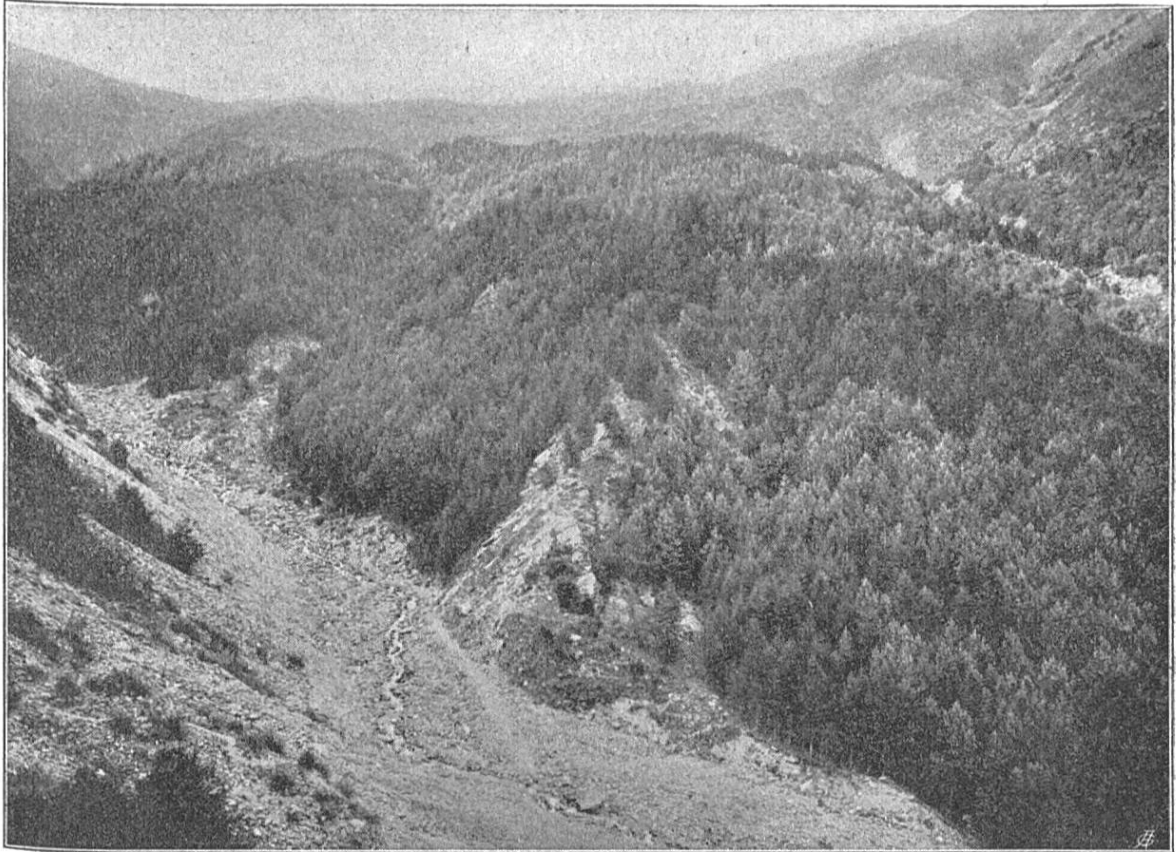
Bassin supérieur du Cassarate, Val Colla. Reboisements au-dessous de l'Alpe di Pietrarossa.

Les travaux entrepris le sont dans le bassin hydrographique du Cassarate. Au commencement du siècle dernier, cette vallée, surtout la rive droite, fut presque entièrement déboisée, afin d'augmenter la surface des pâturages. Mais, guidée par un esprit étroit,