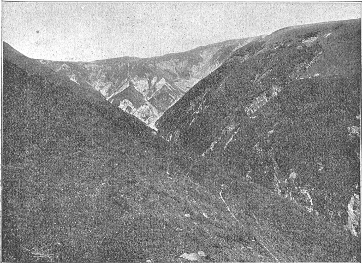
Travaux de restauration dans les torrents et ravins du bassin supérieur du Cassarate, Scareglia. Reboisement des ravins sous Piandanazzo.

En outre, nulle part peut-être, l'exemple n'agit comme en forêt. Ces petites parcelles sont autant de boisés modèles, montrant ce que l'on peut obtenir, avec un peu de persévérance et de bon