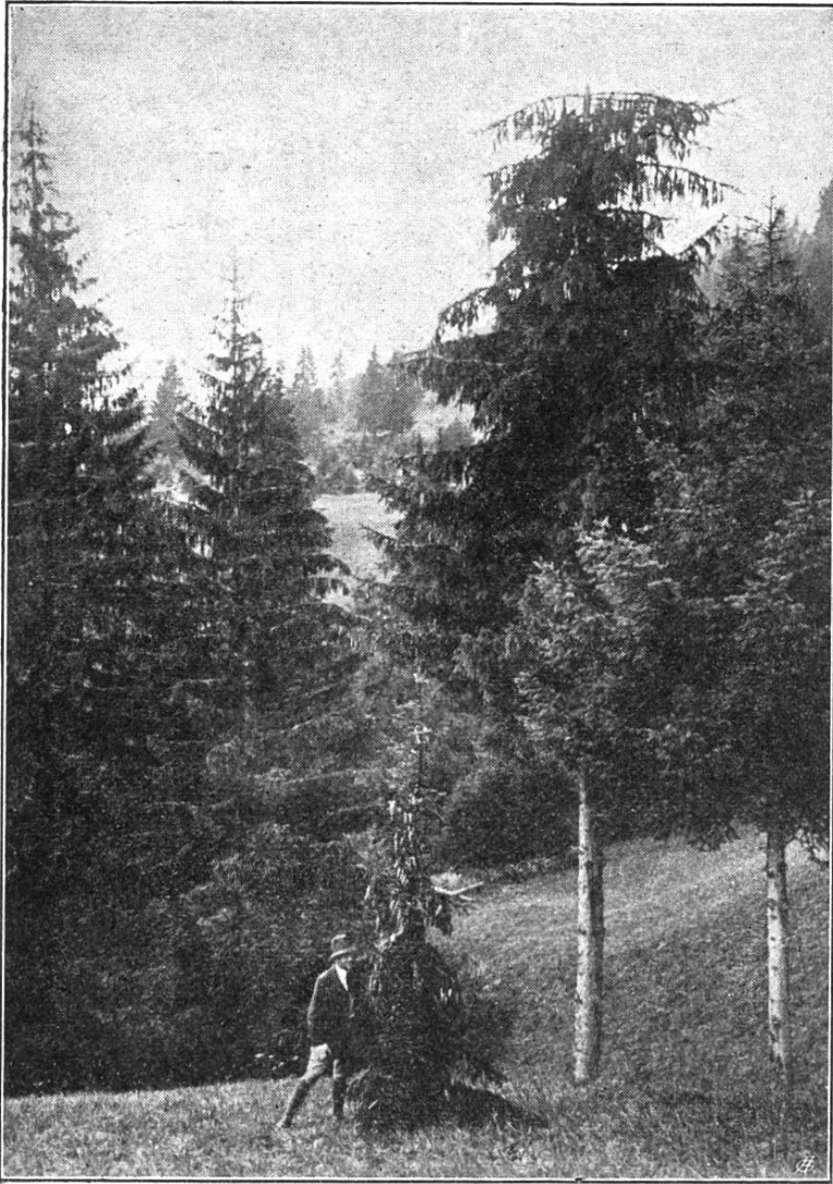
Fig. 3. Cime d'épicéa cassée par le poids des cônes.

1,8 cm et celui du corps ligneux seul de 1,5 cm environ, le moment de résistance de la tige à l'endroit de la rupture ne dépasse guère 0,3. En admettant, pour le moment de flexion, 4 \text{ kg} \times 20 \text{ cm} = 80 \text{ kgcm} (kilogrammes-centimètres), l'effort de flexion à 70 cm du sommet serait donc de \frac{80}{0,3} = 266 \text{ kg} par \text{cm}^3 . On