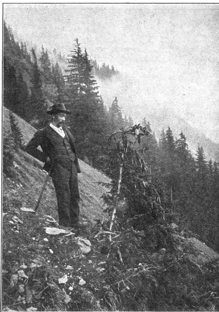
Fig. 2. Cime d'un grand épicéa cassée sous le poids de ses cônes. (82 cônes sur une longueur de 2,1 m.)

Grâce au poids des cônes, un vent même léger suffit pour faire agir la surcharge en dehors de l'axe de la tige. Par un fort vent donnant à la cime une inclinaison moyenne de 45° par rapport à la verticale, le poids total de la portion supérieure (celle-ci mesurant 70 cm au dessus de la rupture), agissant sur son centre de gravité, exerce son action sur un bras de levier de 20 cm environ. Le diamètre de la portion rompue étant, écorce comprise, de