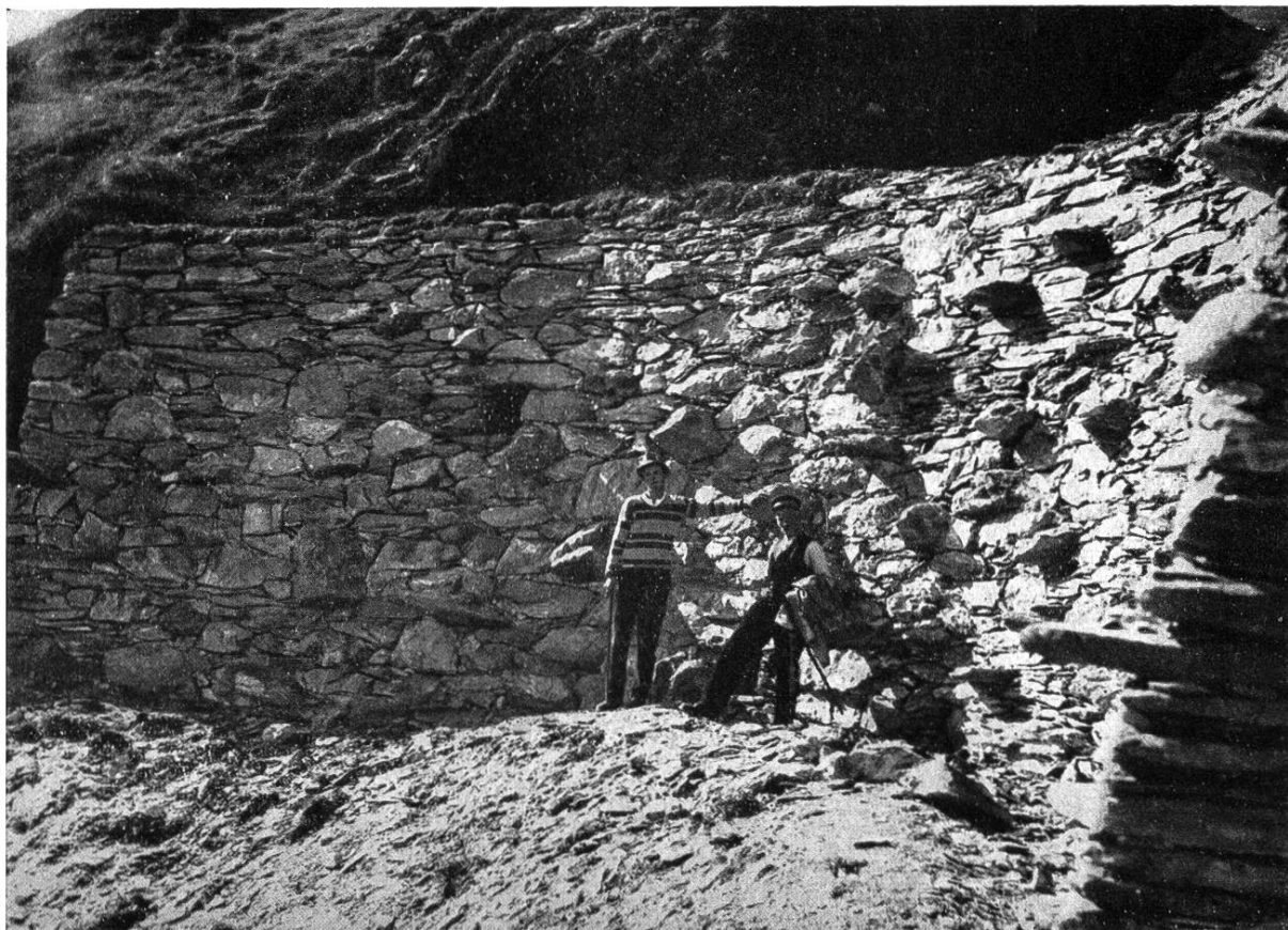
TRAVAUX DE DÉFENSE DE FALDUM MUR CURVILIGNE, AU SCHÖNBÜHL, DANS UNE DÉPRESSION DU TERRAIN Mauvais exemple