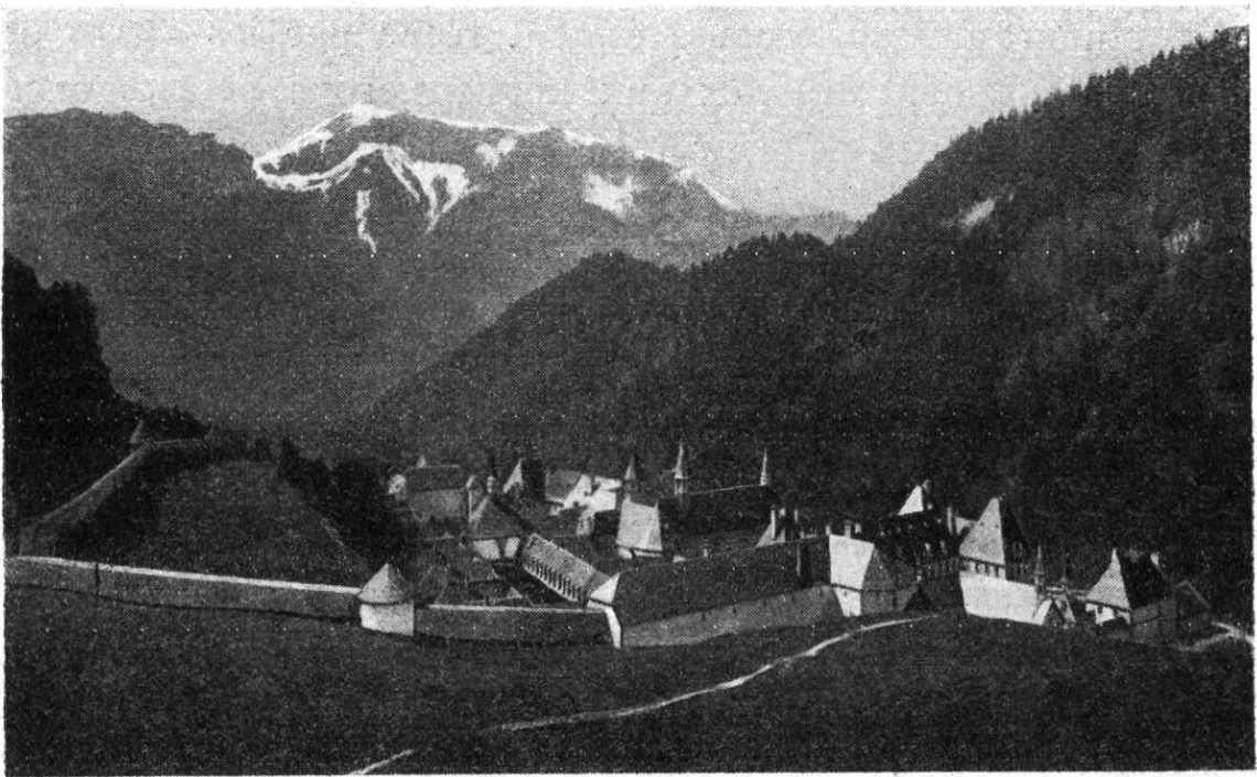
Le couvent de la Grande Chartreuse, près de Grenoble. Vue générale.

On accédait au couvent par deux chemins malaisés, enjambant l'un et l'autre un col à 1400 m d'altitude. On montre encore