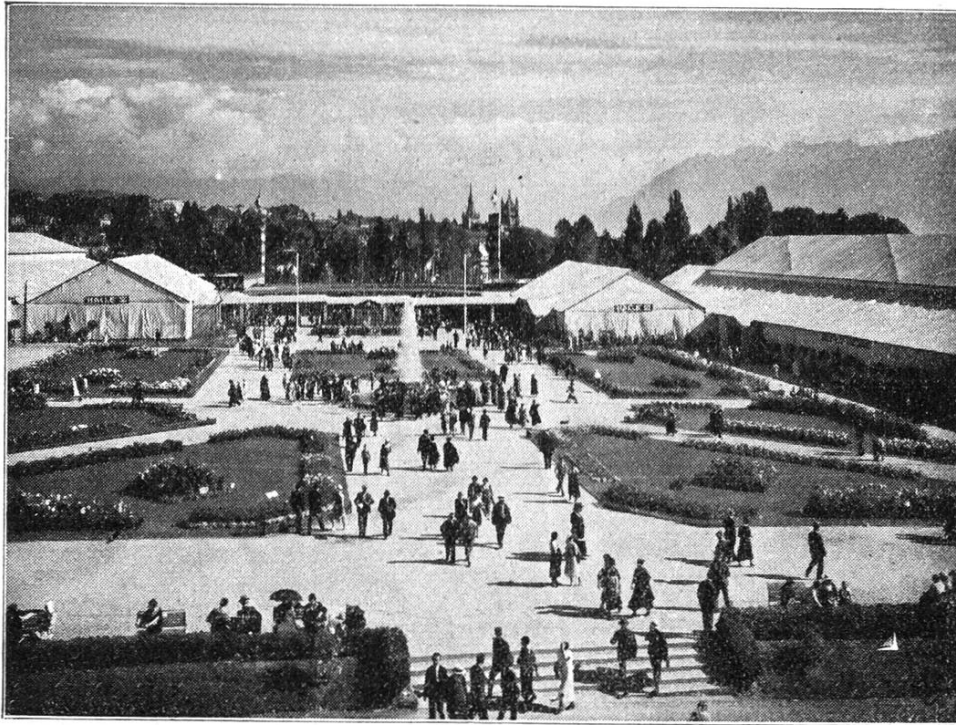
L'entrée du Comptoir suisse.