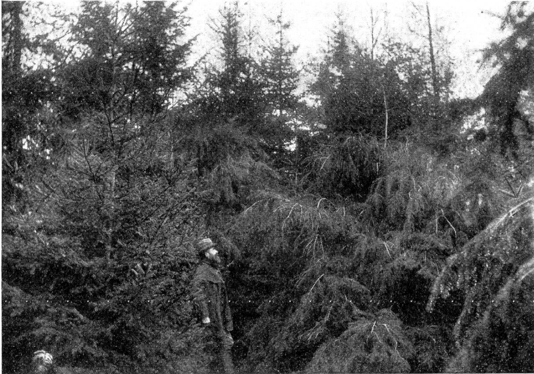
Boisements du plateau de Millevaches (Corrèze).

branches inférieures, même si les arbres sont distants de 1 à 1,50 m les uns des autres. Ce phénomène est d'autant plus marqué, si la plantation a eu lieu sur gazon. En effet, l'air est moins humide sur une prairie que dans une trouée de forêt dont le sol est inévitablement envahi par une végétation herbacée et buissonnante. Celle-ci est capable de maintenir une ambiance propre au développement des champignons parasites, dont l'action en-