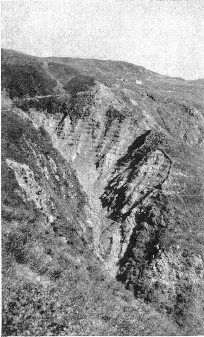
Autre partie ravinée de l'alpe de Piandanazzo.

De 1919 à 1935, on a employé à ces reboisements 1.243.400 plants, dont 343.750 résineux et 899.650 feuillus.