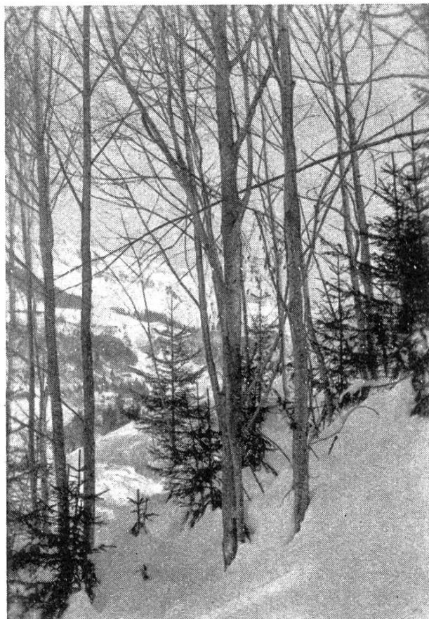
Fig. 1. Rajeunissement d'épicéa sous le couvert de la verne blanche.

Tout en partageant dans une large mesure les idées de M. le D r Hess, sur le rôle de « colonisation » des bois blancs, nous ne