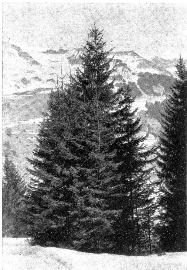
Fig. 2. Groupe de rajeunissement naturel par tutelle.

chacun aurait à couvrir un cercle de 2,50 m de rayon seulement. Et pourtant, à part ces deux arbres, il y a onze flèches qui dépassent 10 m et 127 plants allant de 30 cm à 10 m de hauteur. Une vingtaine de ces plants, à l'intérieur du groupe, ont péri, faute de lumière; autant sont en dépérissement. Mais l'extérieur du groupe est garni de jeunes de très belle venue, dont les flèches sont droites et parfaitement normales, bien que véritablement noyées dans les branches des sujets plus grands. Les 88 épicéas restants se répartissent sur le pour-