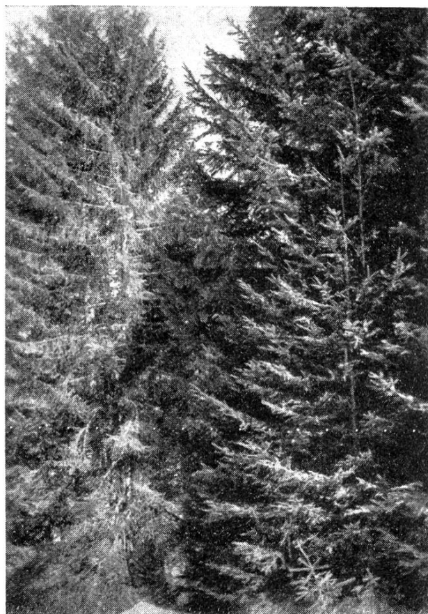
Fig. 3. Jeunes épicéas blottis contre leur tuteur.