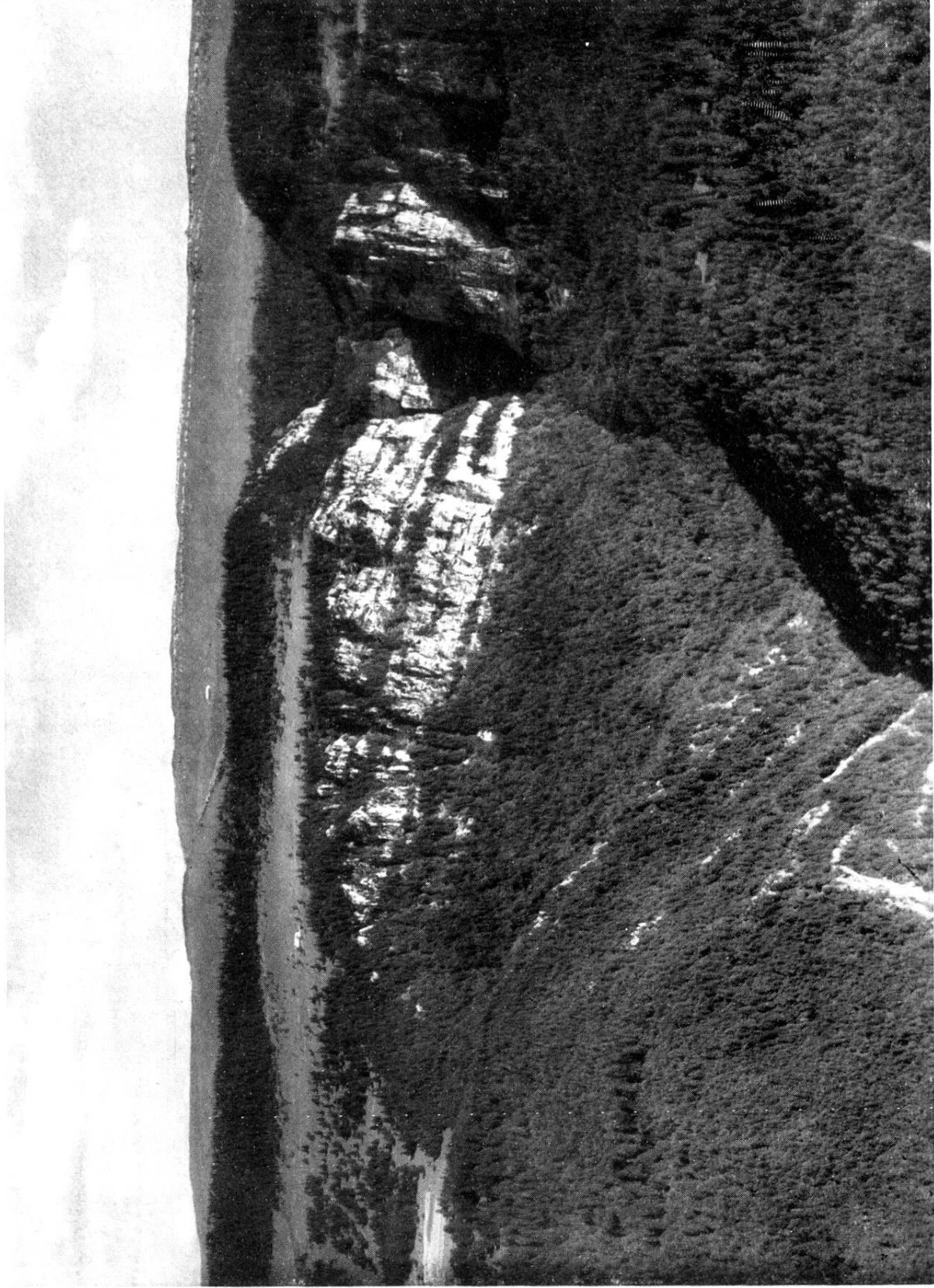
VUE GÉNÉRALE DU PARC JURASSIEN DE LA COMBE-GRÈDE.