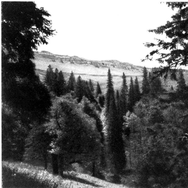
FUTAIE CARACTÉRISTIQUE DES RÉGIONS NEI- GEUSES DU PIED DE CHASSERAL.