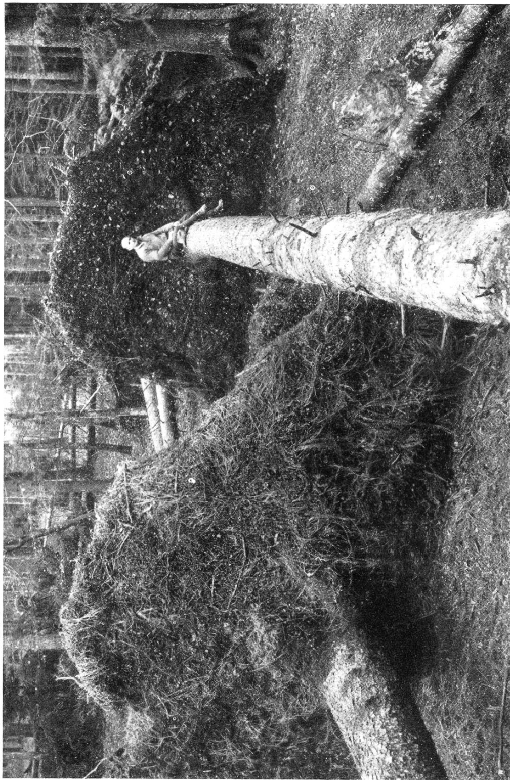
DÉGÂTS PAR LE VENT DANS LA FORÊT DE „HÖFE“. Vue de l'intérieur du peuplement endommagé.