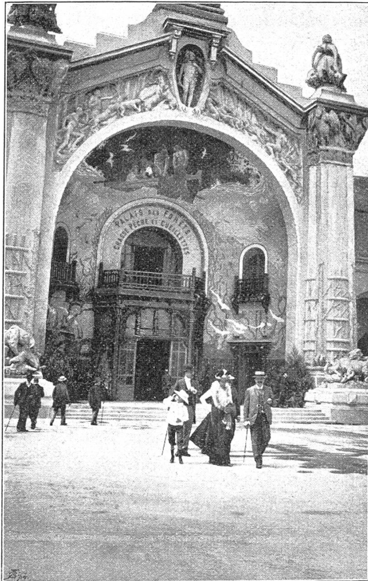
Hauptportal des Forst-, Jagd- und Fischerei-Palastes.

Ueber die forstlichen Verhältnisse Frankreichs im allgemeinen geben eine große, nach Waldbesitzverhältnissen kolorierte Karte, statistische und